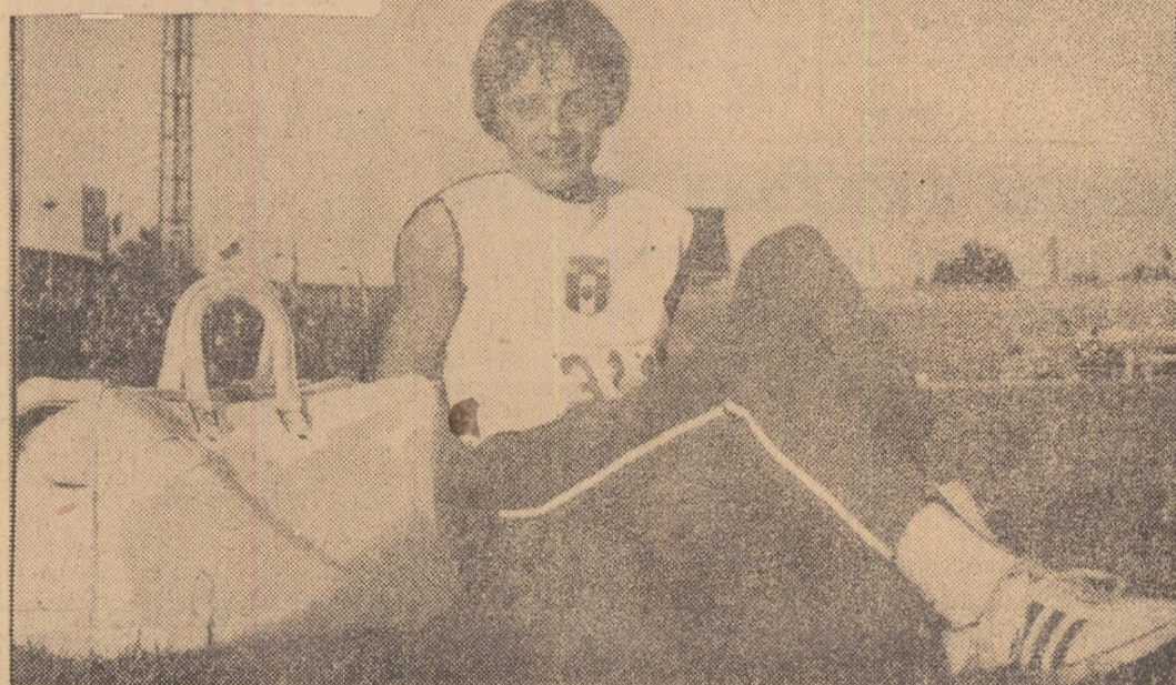
(Alte amănunte în pag. a 4-a)

Poate cel mai important record al Liei, în fața căruia își scot pălăria toți specialiștii atletismului internațional, este cel de longevitate sportivă. În cariera sa, începută cu peste 20 de ani în urmă, Lia Manoliu a reușit să obțină succese greu de estimat: medalie de aur la Ciudad de Mexico (1968), medalii de bronz la Roma (1960) și Tokio (1964), pentru a vorbi numai de locurile obținute pe podiumul J.O. Participarea la 5 ediții ale Jocurilor Olimpice (!), numeroase victorii realizate la Internaționalele României și la concursurile de amploare desfășurate peste hotare, precum și recentul record național (de aproape 60 m), completează superbă „carte de vizită” a acestei excelente sportive. La întrecerile de sâmbătă și duminică, Lia va adăuga, cu siguranță, la acest colier o nouă perla.