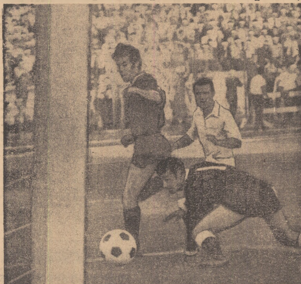
Intervenția portarului este tardivă. Dumitrache înscrie cel de al patrulea gol

IAR U.T.A. O MARE REVELAȚIE: 1-1 CU FEIJENOORD!! (în „Cupa campionilor europeni“)