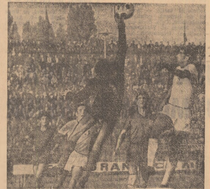
Faza de poartă, din acelea care fac deliciul „tribunelor”...