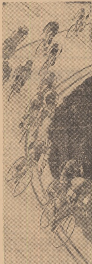
Acalmie pe turnantă, înaintea unui nou sprint