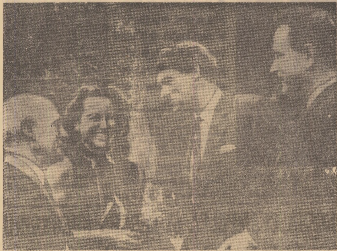
O parte dintre participanții la congres se întrefin amical după terminarea lucrărilor. Ultimul din dreapta este semnatarul acestui articol.