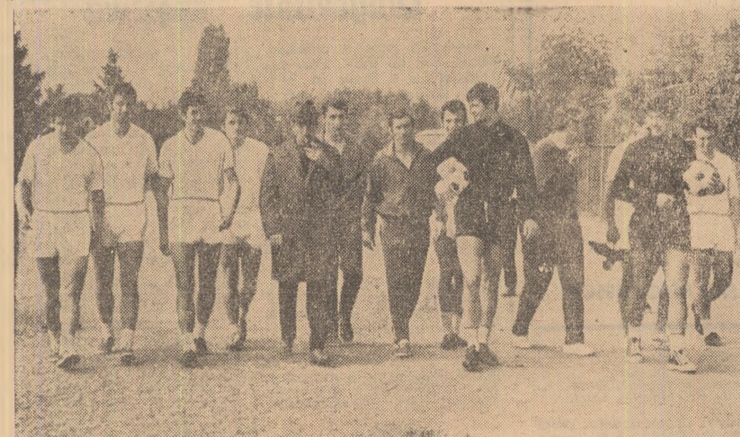
Ozon și elevii lui la antrenamentul de ieri, din București.