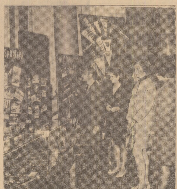
Apropiata sărbătorire a semicentenarului clubului sportiv Medicina București este punctată printr-o serie de acțiuni care rețin în mod deosebit atenția. Una dintre ele este și cea prilejuită de vernisajul unei expoziții inedite, de mari proporții, intitulată sugestiv „MEDICINA BUCUREȘTI 1920-1970”.

Găzduită în localul Facultății de Medicină Generală din bd. Dr. Petru Groza nr. 8, expoziția oglindește într-un mod convingător istoria acestui club, frunțas îndeosebi la jocuri sportive (volei, baschet, fotbal etc.).