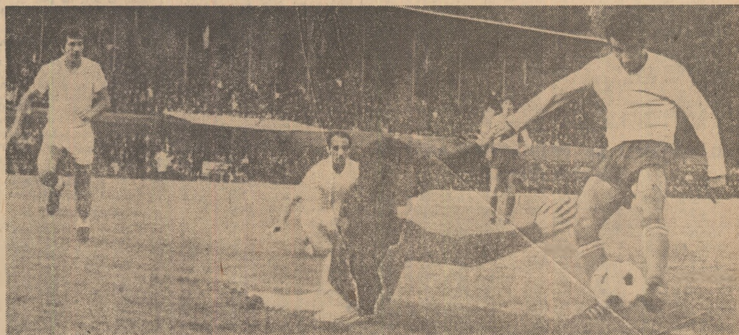
Șutul lui Neagu, cel mai periculos atacant ieri, va fi de data aceasta blocat de către portarul Șerban.