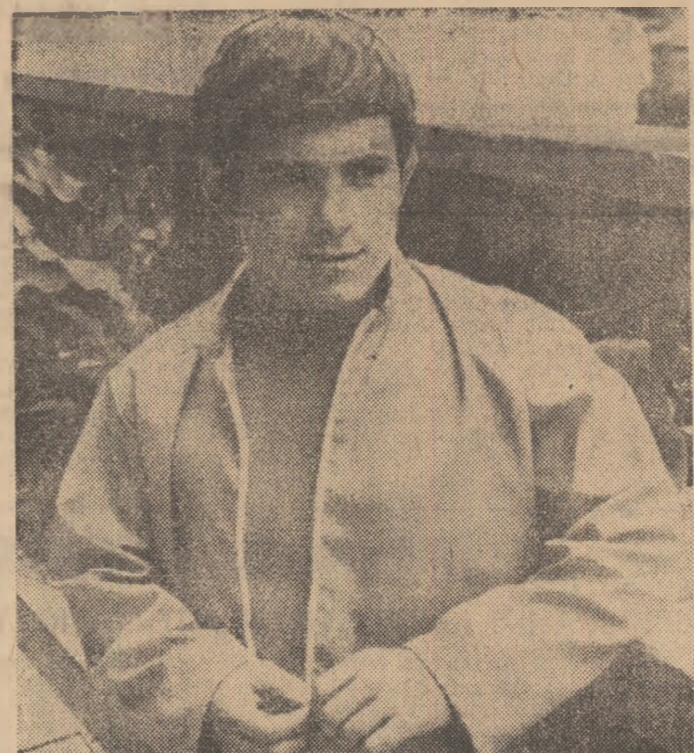
Gheorghe Berceanu — campion european, de două ori campion mondial — foarte sigur de el