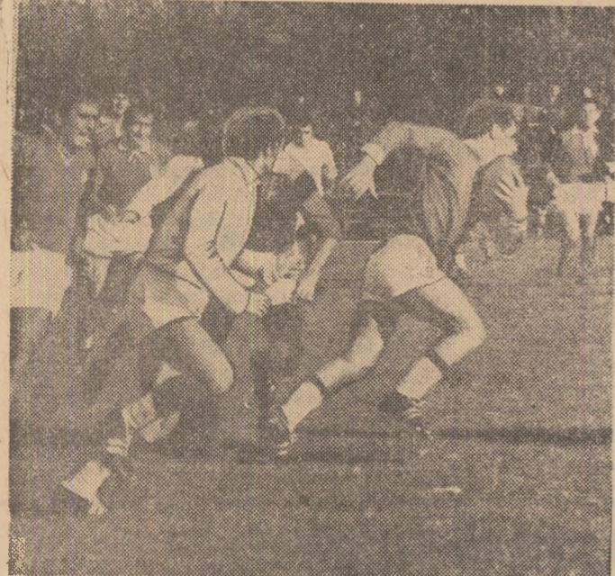
Atacul rugbyștilor de la Grivița Roșie va fi cu greu oprit de apărarea Rapidului

de obținut o victorie poate mai facilă decât o arată scorul. La drept vorbind, dinamoviștii au înscris ori de câte ori au vrut, acționând în viteză și cu treisferturile,