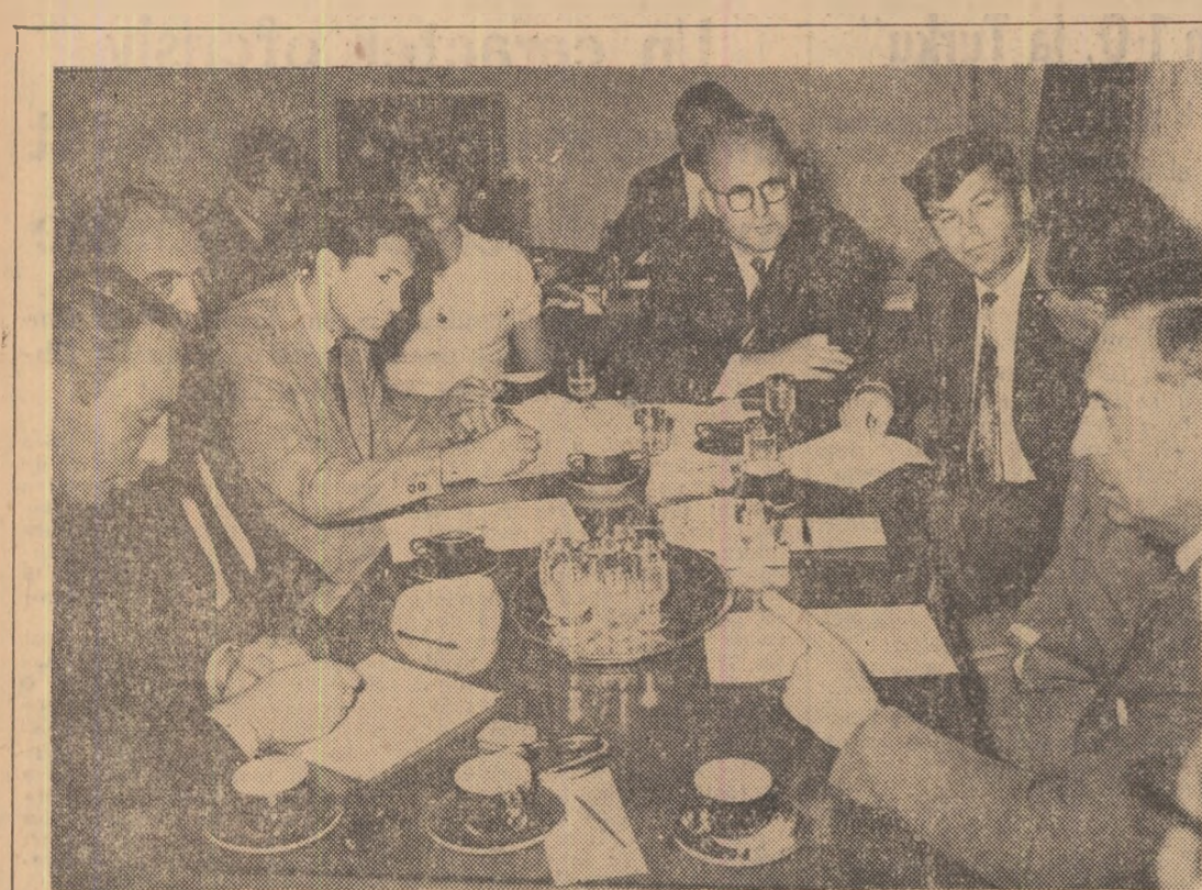
Aspect din timpul dezbaterilor problemelor voleiului în redacția ziarului nostru.

Rezultatele obținute de reprezentativele României la recentele campionate mondiale de volei, desfășurate în Bulgaria, au dezamăgit pe iubitorii acestui sport. De altfel, din păcate, se poate spune că există în această ramură sportivă o situație de insatisfacție. La „Cupa Mondială” (Berlin, 1969) echipa masculină s-a clasat pe locul VII, la campionatele europene de tineret de la Tallin (1969), formația feminină n-a avut acces în finală, iar la Universiada (Torino, 1970), reprezentativa studentescă de fete — care s-a confruntat cu naționala — a ocupat locul IX.