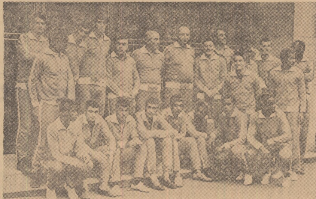
O fotografie pentru cititorii ziarului Sportul. Iată-i pe fotbalisții brazilieni, la cîteva minute după vizita prin Capitală.

● Bucureștenii aliniază cea mai bună formație ● F.C. Bangu (locul VI în campionatul statului Rio), o echipă de prestigiu ● Antrenorul José Alves do Rio: „Meci foarte greu cu Rapid, dar ne vom străduji ca jocul să placă publicului”