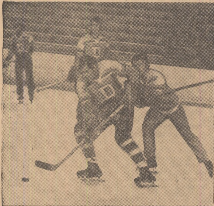
Zile febrile de antrenament pe Patinoar. Se pregătesc hocheiștii de la Dinamo