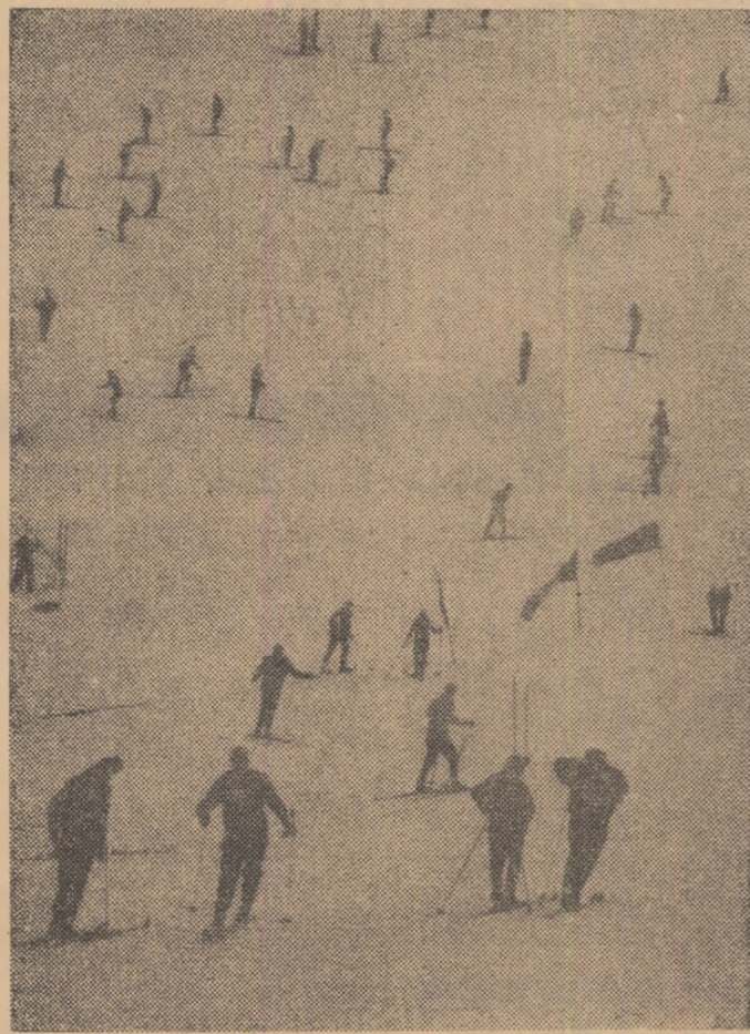
Alb și negru... pe pârtea Clăbucetului.