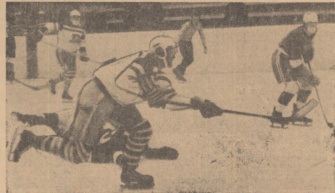
Atac al dinamoviștilor la poarta hocheiștilor din Miercuria Ciuc.

Penalizări: Dinamo 4 minute, Avîntul 4 minute.