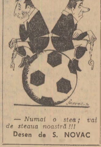
Desen de S. NOVAC