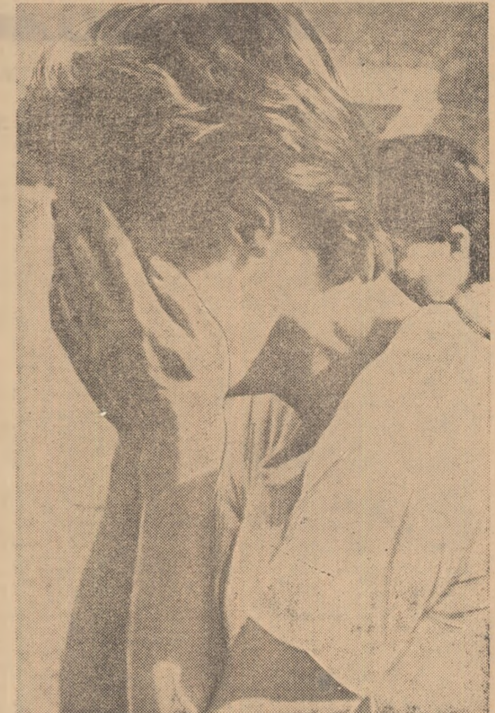
Izbușnirea nervoasă este justificată. De această dată tentativa n-a reușit. Dar timpul n-a trecut...