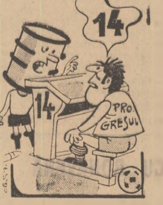
Petrolul: — Te rog să stai cuminte în... BANCA T A I