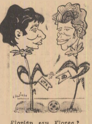
Florin sau Floarea?