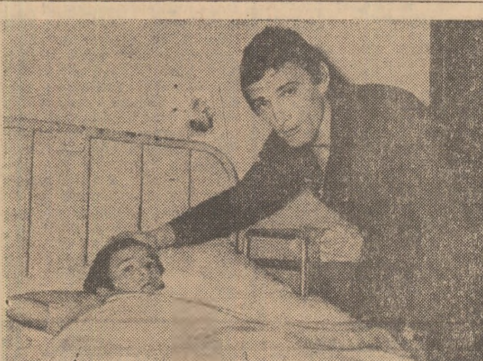
VICTIMA LUI RIVA

Ar fi, desigur, greșit de a trage de aici concluzii dezastruoase pentru jocul cu balonul rotund. Căci în definitiv cu ce este vinovat fotbalul dacă printre adepții săi se găsesc și destul răufăcători? Mai bine să se joace cît mai mult fotbal!