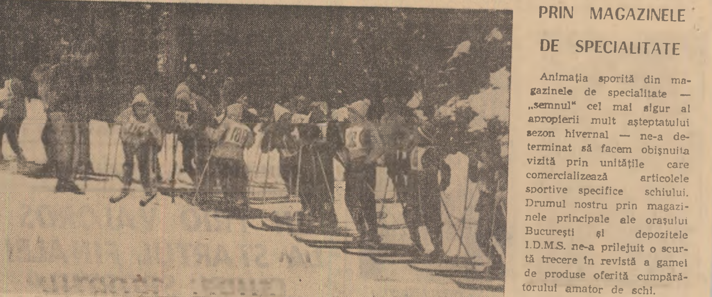
Copiii sînt dornici de schi și participă în număr mare la concursuri. Ar veni și mai mulți dacă în magazine s-ar găsi schiuri și pentru ei.