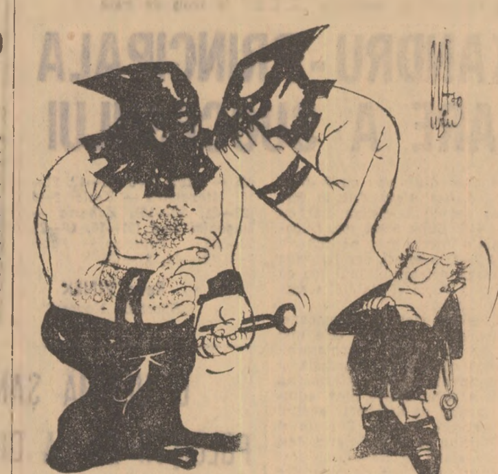
— Il vom tortura! Il vom trece prin joc și apă! Il vom... — Nu ține! E tare omul! A arbitrat la Moinesti! Desen de N. CLAUDIU

● La Moinesti, cind pierd gazdele ● Mina protectoare a inginerului Talpa ● Mașina misterioasă ● A dat ordin „șefu“