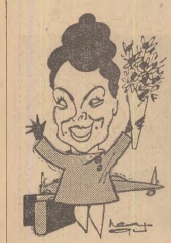
SHIRLEY TEMPLE BLACK văzută de Neagu RĂDULESCU

„Cu Shirley Temple Black despre sport... Pentru iubitorii sportului românesc..."