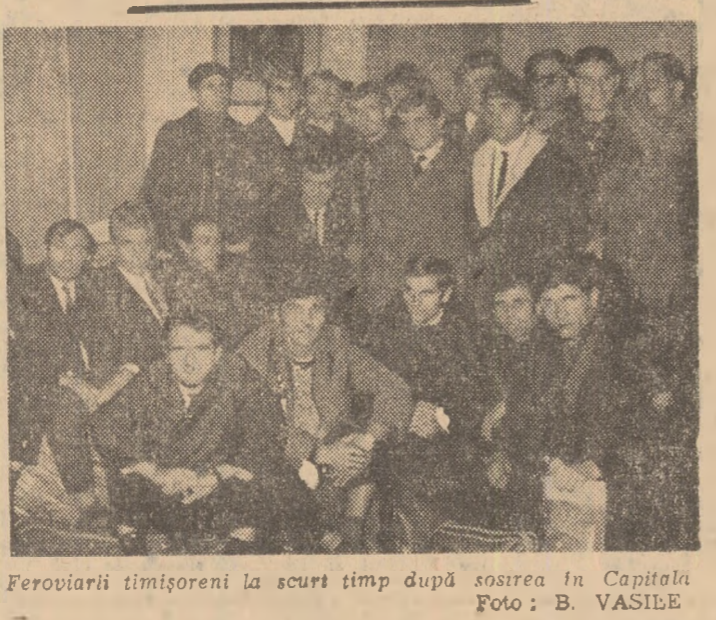
Feroviarii timișoreni la scurt timp după sosirea în Capitală.

După jocul de marți, cu Rapid, F.C. Curitiba va pleca la Pitești, unde miercuri urmează să susțină o nouă partidă, de data aceasta în compania lui F.C. Argeș.