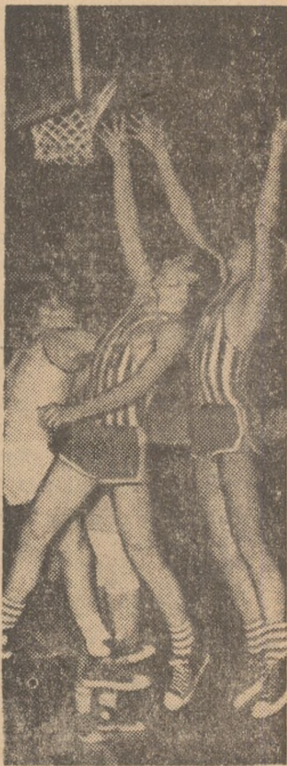
Luptă pentru minge în meciul Politehnica—I.E.F.S.