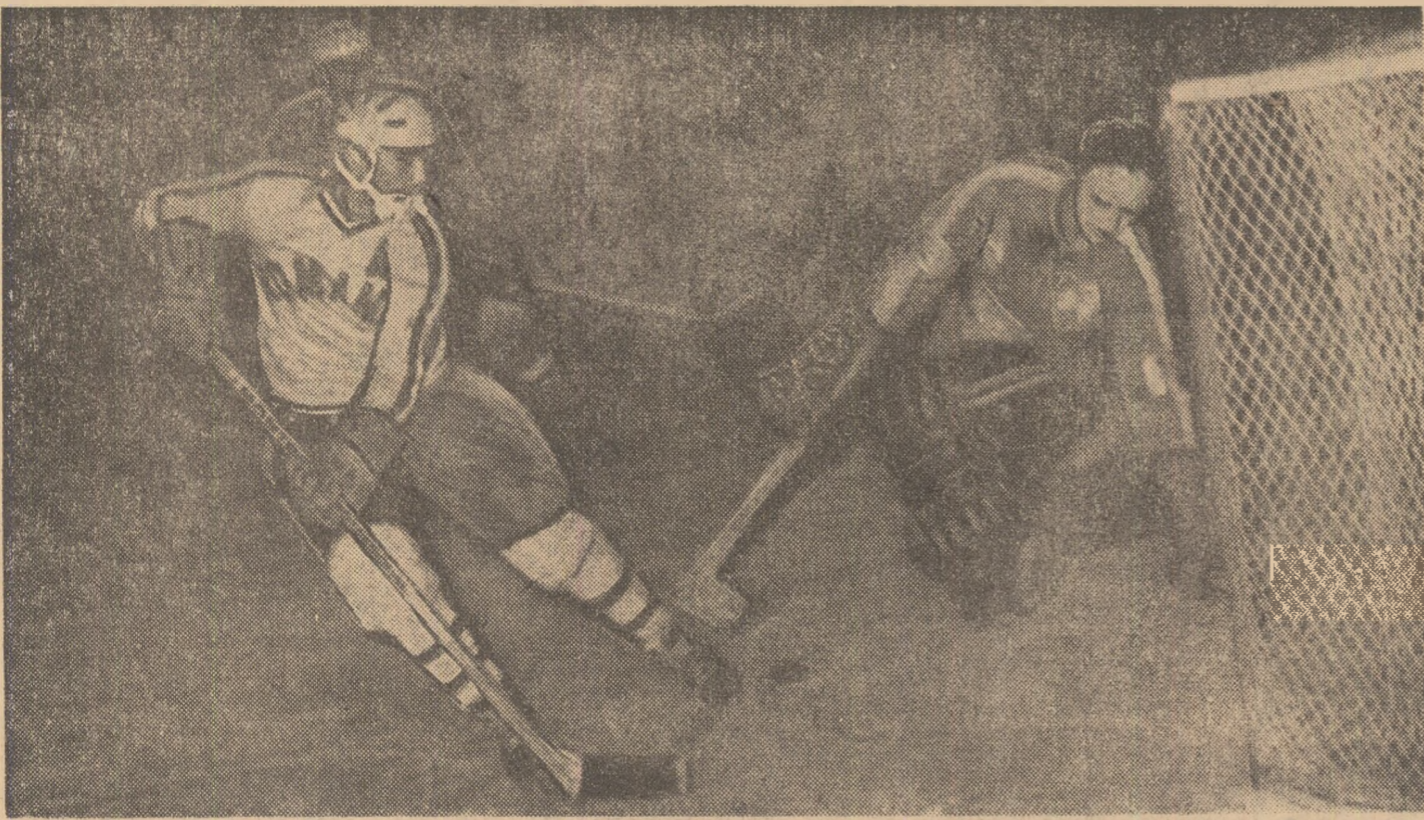
Singur cu portarul polonez, Fodorea — excelent în partida de ieri — va rata această ocazie cu care echipa noastră putea deschide scorul.