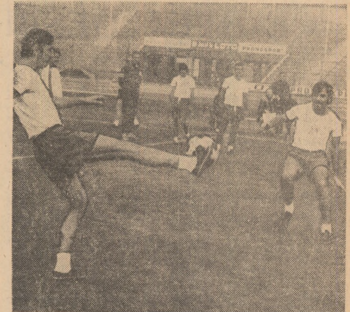
IERI, PE STADIONUL REPUBLICII

Ieri după-amiază, fotbaliiștii de la F. C. Curitiba au făcut cunoștință cu gazonul stadionului Republicii. Antrenorul Mauro a lucrat cu elevii săi aproximativ 60 de minute. După obișnuitele exerciții de încălzire, Mauro a împărțit lotul în două echipe, care au jucat la „două porți“. În timpul jocului n-au existat posturi fixe, fiecare jucător îndeplinind ambele roluri, de apărător și de înaintaș. În imaginea ce v-o prezentăm, fotoreporterul nostru V. Bageac a surprins un moment din antrenamentul fotbaliiștilor brazilieni.