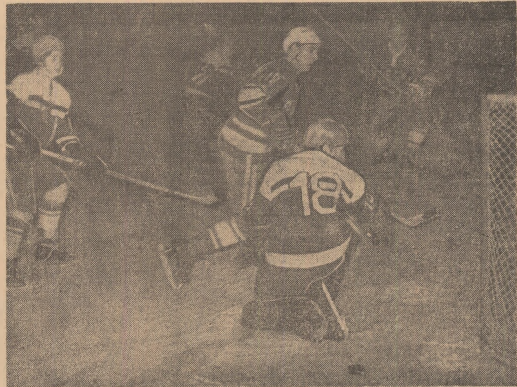
Acțiune ofensivă a tinerilor hocheiști sovietici la poarta echipei R. D. Germane.

Hocheiștii români vor lupta, împreună cu juniorii din R.D. Germană, pentru cucerirea medaliilor de bronz