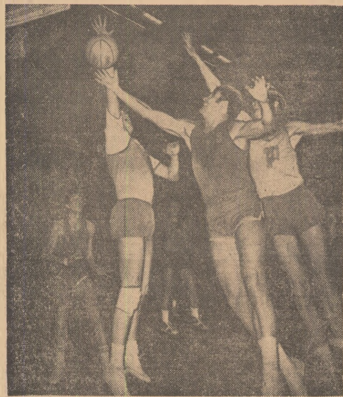
Fază din meciul Steaua—Politehnica Brașov