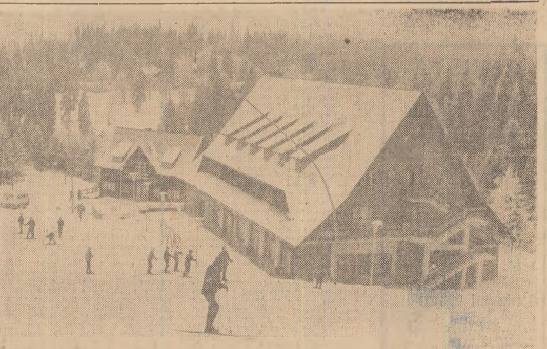
Modernul hotel de la Clăbucet-sosire, gazdă primitoare a turiștilor și schiorilor