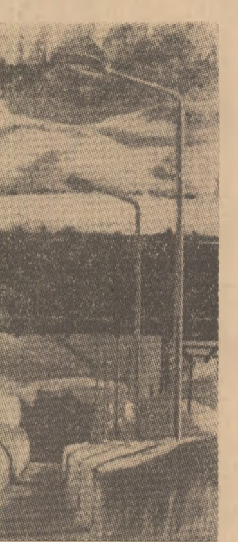
Un „monument al naturii” la 2000 m altitudine: prîria de la Alpe d’Huez (Franța), de doi ani nefolosită

2. Deosebitele eforturi depuse de elvețieni, români și americani pentru a reînnoia firul marilor performanțe. Primii așteptați din 1955, românii din 1954, americanii din 1939. Toți au fost aproape de victorie, mai ales la Lake