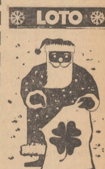
TRAGEREA REVELIUNILOR 1 Ianuarie 1971

Puteți câștiga în număr NE-LIMITAT: • Autoturisme DACIA 1300, MOSKVICI 408 cu caroserie 412, DACIA 1100, SKODA S. 100, FIAT 850; • Excursii în ITALIA (cu avionul) cca. 8 zile; • Excursii în R. D. GERMANIA (Berlin — Leipzig — Dresda) cca. 10 zile; • Premii în bani. Nou! Cu variantele de 15 lei puteți câștiga autoturisme și la extragerile I și II-a (de la premiile obișnuite în numerar).