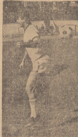
tot ce pot. Și nu întotdeauna am fost înțeles de coechipieri. A fost de ajuns să înscriu primul gol, ca să mă trezesc uneori... singur în teren. Nu vreau să cred că a fost vorba de egoism. Apoi, în numele sincerității, vă mărturisesc că