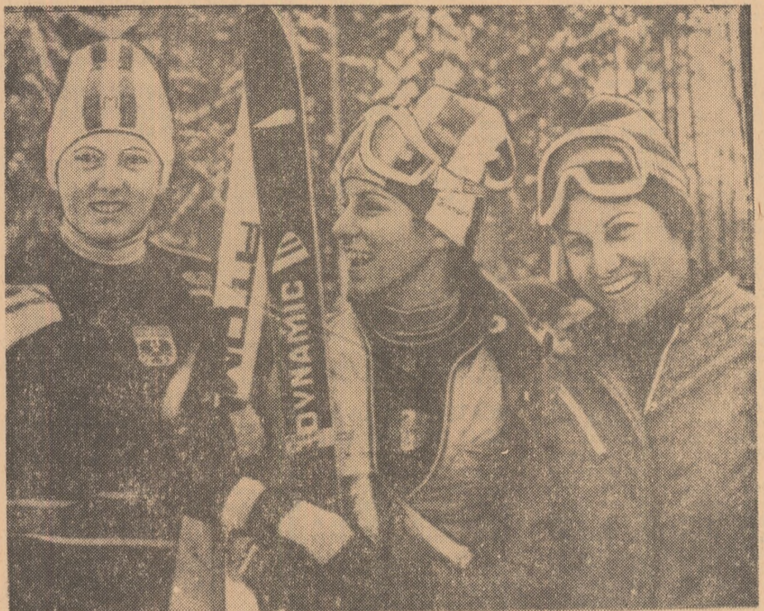
Cele trei premiate ale slalomului urias de la Maribor pozează obiectivului fotografic (de la stînga la dreapta): Anne-Marie Proell, Françoise Macchi și Gertrud Gabl.