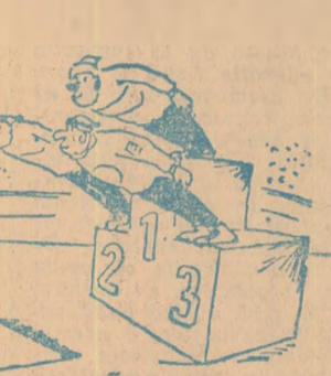
Zburătorii pe schiuri nu se demint... (din „Nepsport”—Buapești)

solii a fost un înolător de frunte. Este suficient de amintit că el a reprezentat Italia la Jocurile Olimpice din 1952 și 1956 și a detinut timp de 11