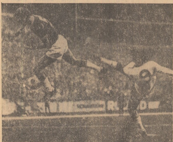
Fotbalistul nr. 1 al Europei, împetușos Gerd Müller (dreapta) într-o ipostază curioasă, propulsîndu-și parcă adversarul printr-un suț formidabil. Bineînțeles, este vorba doar de un efect fotografic, în acest instantaneu luat la meciul întîr-tări R. F. a Germaniei—Turcia, disputat în toamna trecută la Köln.

solii a fost un înolător de frunte. Este suficient de amintit că el a reprezentat Italia la Jocurile Olimpice din 1952 și 1956 și a detinut timp de 11