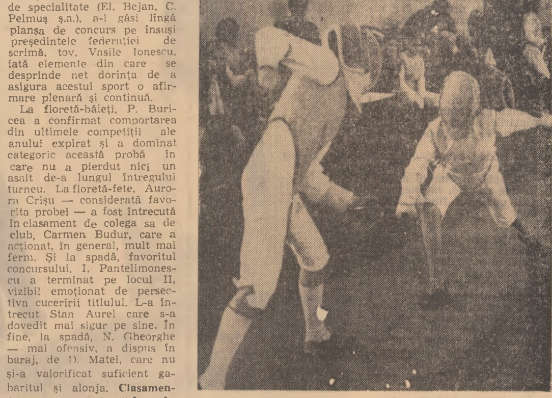
Unul dintre duelurile mici lor competitori urmărit cu admirație de spectatori prezenți în sală

5v; 2. I. Pantelimonescu (S.S.1) 3v; 3. Em. Nuță (C.P.M.B.) 3v; 4. M. Gaidaruc (C.S.S.) 2v; 5. N. Gheorghe (C.S.S.) 1v; 6. D. Marin (S.S.1) 1v. SPADĂ: 1. N. Gheorghe (C.S.S.) 4v d.b.; 2. D. Matei (Universit.) 4v d.b.; 3. C. Rogescu (C.P.M.B.) 3v; 4. M. Gaidaruc (C.S.S.) 2v; 5. T. Iorgu (Steaua) 2v; 6. D. Rădulescu (C.P.M.B.) 0v. Ion F. BACIU