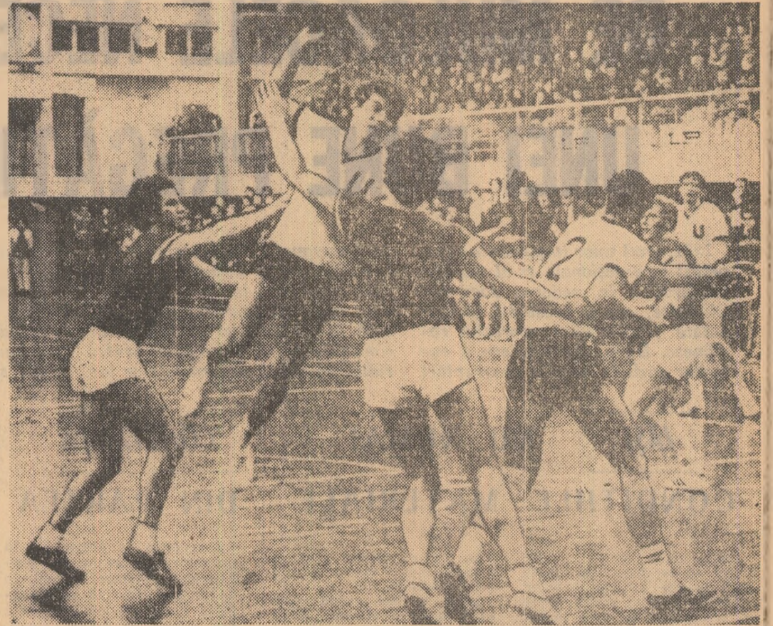
Un atac al studenților clujeni care nu a mai putut fi stăvilit de apărarea handbaliștilor de la Știința Lovrin