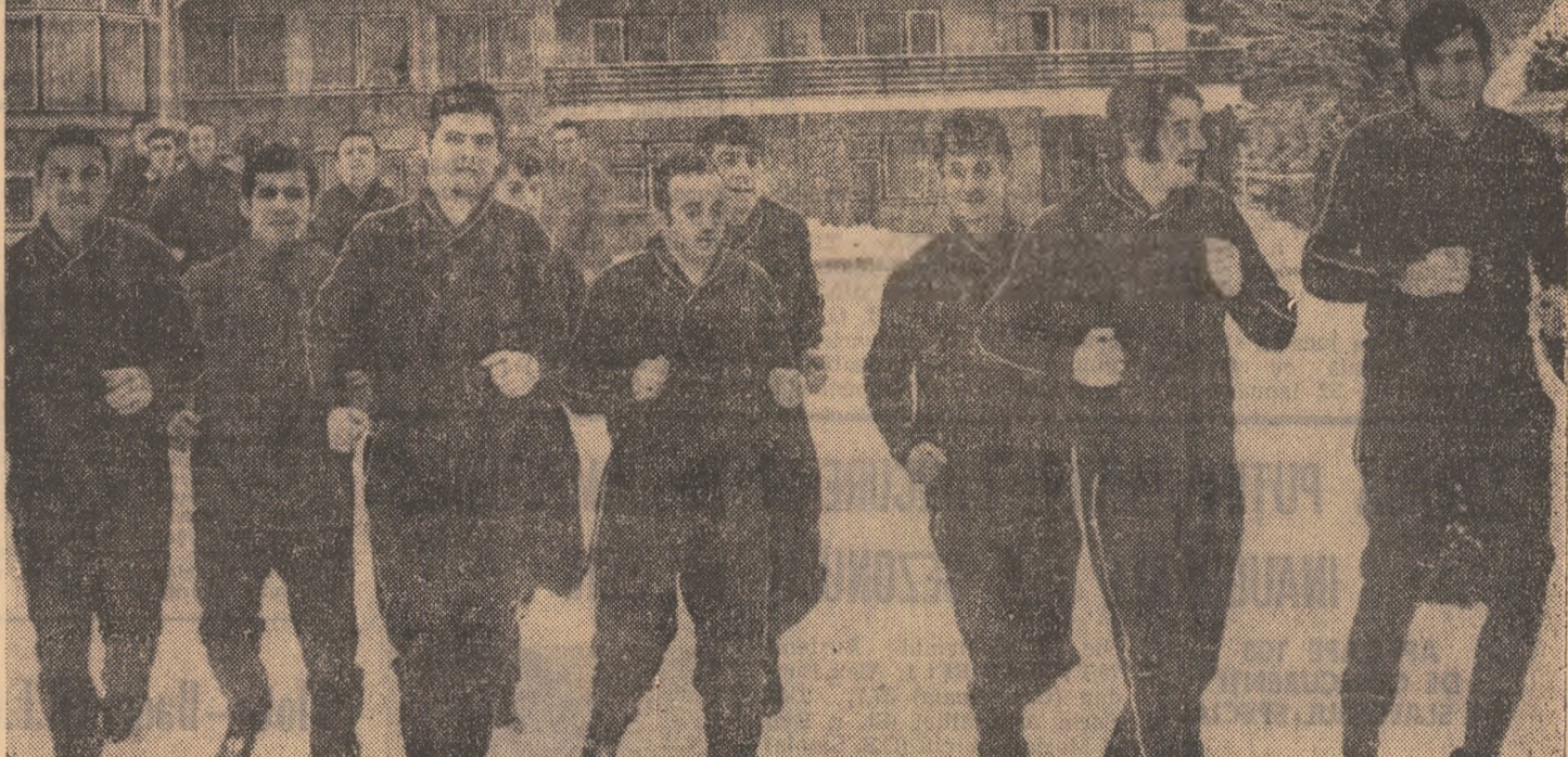
Start în prima „serie”, de încălzire, a jucătorilor Rapidului — sezență surprinsă, pe fundalul hotelului „Timiș”. Antrenamentul abia începe...

ții, liniștiți și civilizați. Neagu ni se pare cel mai volubil: — Niciodată nu am început anul cu antrenamente așa tari! Nea Cristache (n.n. — antrenorul secund Cristescu) alegară tot la cot cu noi, de parcă ar urmări... un loc în echipă, nu altceva. Ieri, Dau i-a strigat în glumă: „nea Cristache, ai grijă că diseară cazii morți!” Știi ce a răspuns? „Lasă, Dane, nu mă plinge tu pe mine, că pînă la urmă tot își spune cuvântul... tine-rețea!”