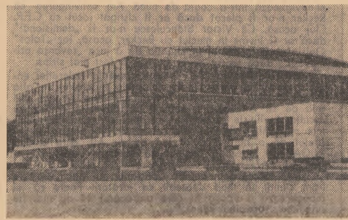
Modernă sală a sporturilor din Cluj oferă posibilitate reprezentanților de frunte ai sportului clujean să se pregătească în bune condiții