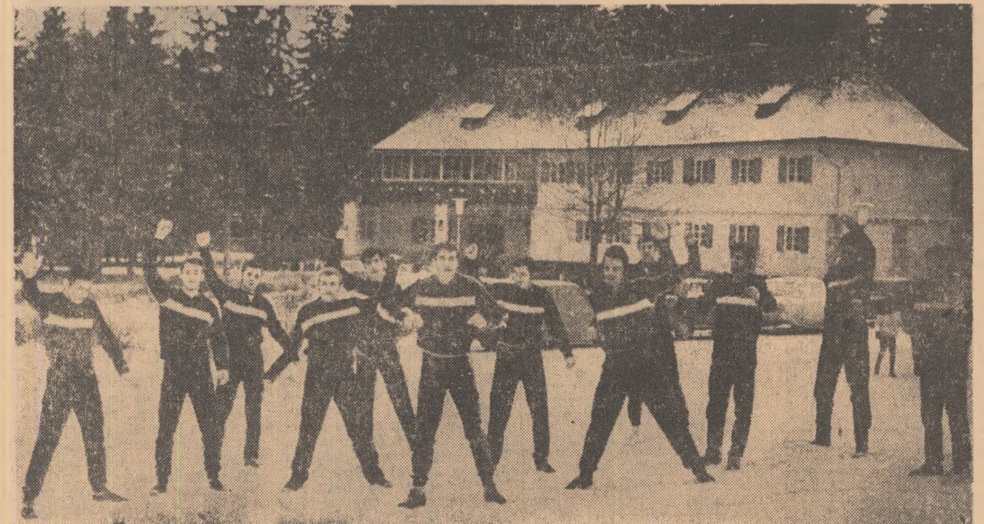
La Poiana Brașov, fotbalistii Steagului roșu — surprinși de fotoreporterul nostru Theo MACARSCHI — în timpul exercițiilor de gimnastică, executate dis de dimineață...