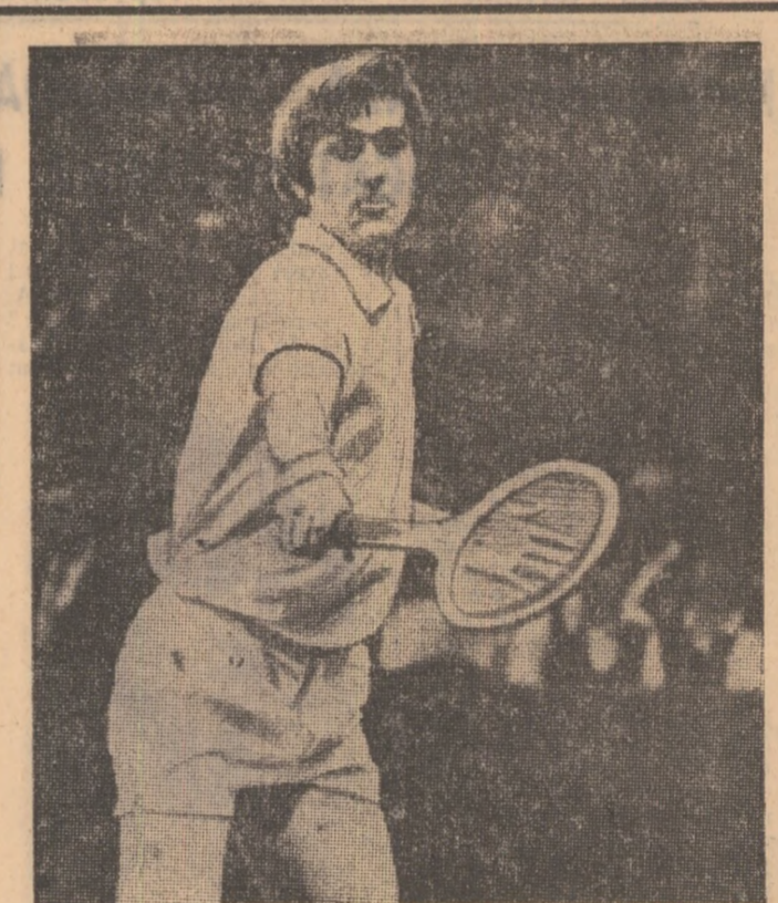
Ilie Năstase evoluînd la Salisbury, în finala care avea să-i aducă titlul de campion internațional pe teren acoperit al S.U.A.

După 1744 km parcursi, în Cursa ciclistă de 6 zile, care se desfășoară în prezent pe velodromul acoperit din Bremen, pe primul loc s-a trecut curșorul belgian Rudi Altig — Albert Friz — în mezza la un tur perechele Post (Olanda) — Sercu (Belgia) — Van dahl (Belgia) — Germeier (Elveția). Ea a totalizat în cele două