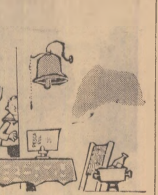
Ospătarul: — Sinteți suporterii Rapidului? Perfect! Vă dau o masă lângă... clopot!