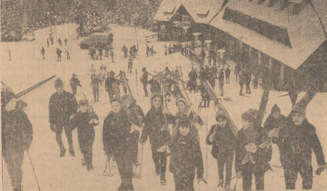
Cînd zăpada se așterne peste pîrtii, nimic nu-i mai poate reține pe cei ce vor să cunoască într-adevăr bucuriile terne! Aidoma școlărilor din secția de schi a Șc. sp. din Bredeal, mii de tineri și tînere din întreaga țară înundă pîrtia Clăbucetului, ca și alte pante din lanțul carpatic. Cu condiția să fie... zăpadă!