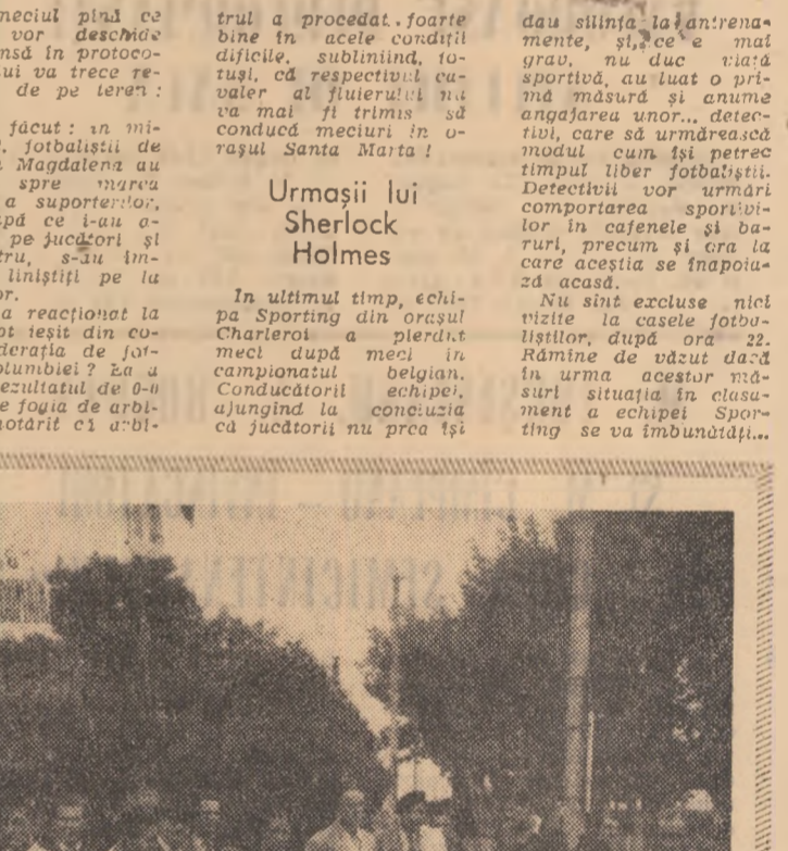
Din albumul cu amintiri