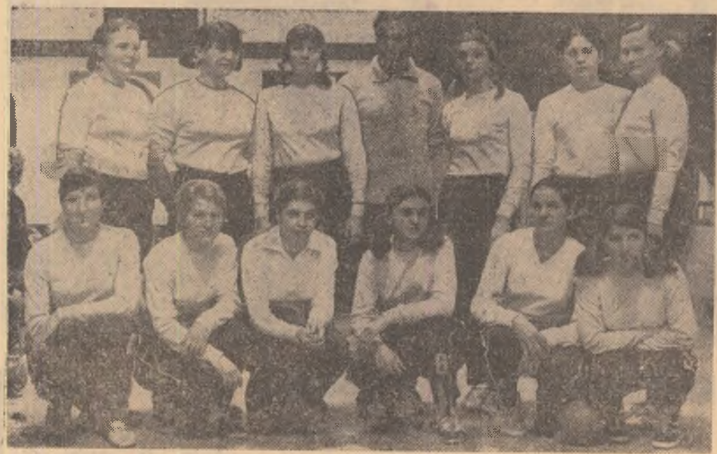
Prin victoria de ieri, asupra Universității București, studențele timișoare (în foto) și-au mărit șansele să-și păstreze titlul de campioane.

CLUJ, 24 (prin telefon, de la trimisul nostru). În sala sporturilor a început duminică după-amiază cea de al treilea turneu de sală — ultimul — al campionatului feminin de handbal, divizia A. A fost o reuniune a surprizelor, a derbyului dintre fruntașii clasamentului, Universitatea București și campiona ultimilor trei ani, Universitatea Timișoara. Victoria în acest meci de mare tensiune a revenit timișorencelor care, grație acestui succes, preiau poziția de lider.