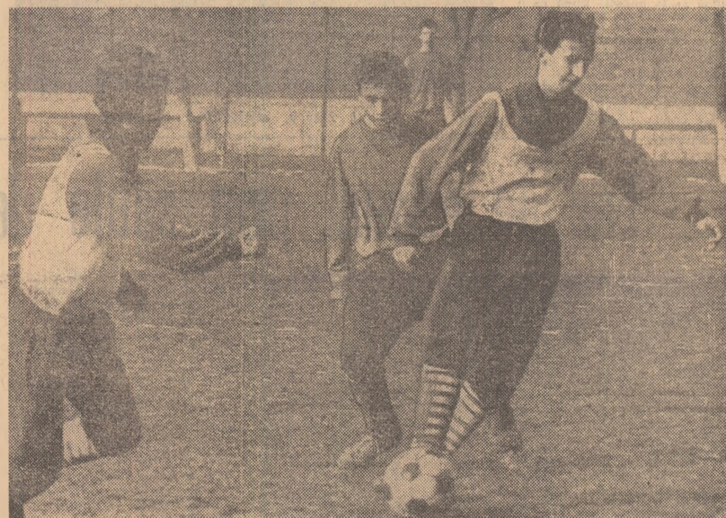
Pe un timp primăvăratic

Azi, de la ora 9, la poligonul Dinamo, va avea loc mînașă II-a a trialului. (T.R.)