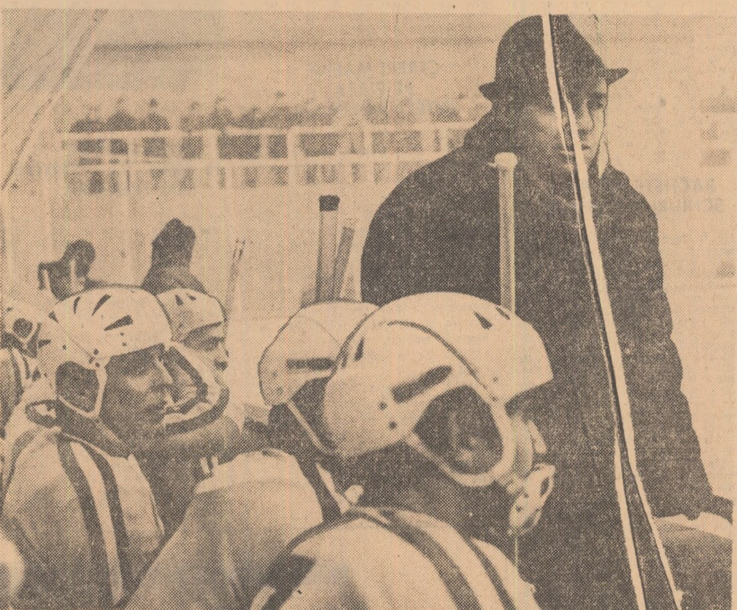
Momente de tensiune pentru hocheiștii echipei Bucureștiului... Antrenorul secund, Fămaropol și „caschetele albe” urmăresc cu răsuflarea tăiată întrecerea de pe gheață!