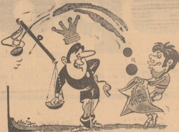
Hocus-Pocus Desen de AD. CLENCIU