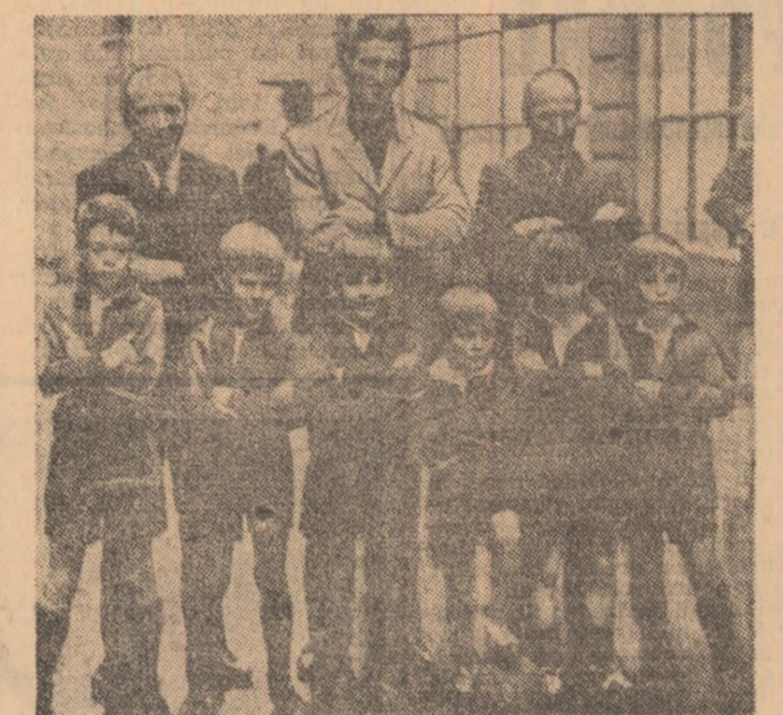
Trei celebriități actuale: Matt Busby, Bobby Charlton, Derek Dougan și șase celebriități ale anului... 2000!

Nenumărați vizitatorii ai Londrei vor avea în curînd posibilitatea să viziteze „lăcașul gloriei“ fotbalului englez, situat chiar în inima capitalei: o expoziție permanentă a soccerului se va deschide în luna martie pe Oxford Street.