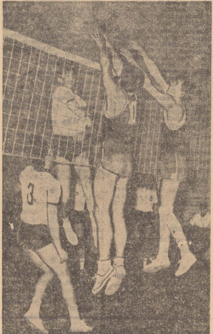
Blocajul voleibaliștilor de la Rapid respinge un nou atac al Universității Cluj