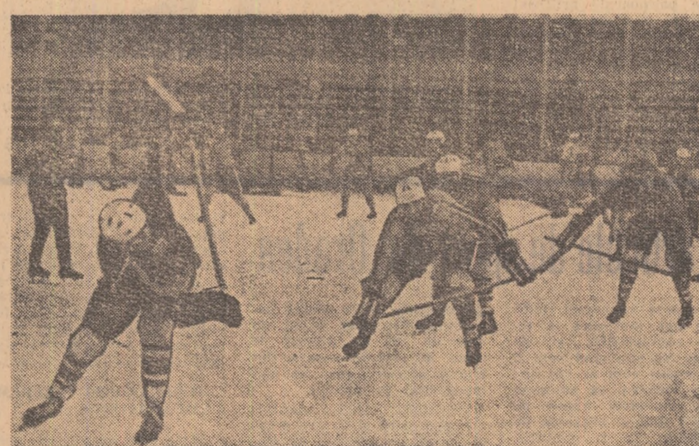
La antrenamentul de ieri al lotului național de hochei (Cîițiți reportajul în pagina a 2-a, la rubrică).