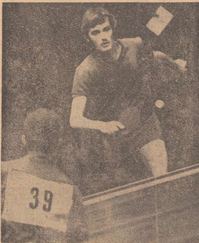
mare, sîntem siguri, cei care vor fi prezenți azi în tribunele de la Floreasca nu vor avea ce regreta în privința spectacolului la care le va fi dat să asiste. Să sperăm că și comportarea reprezentanți-

Dar, competiția se va afla de azi în plină desfășurare, cînd sînt programate partide decisive la patru din cele cinci probe individuale (la mixt se va juca joi). Prin ur-