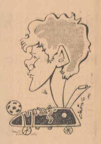
BOLONI văzuți de AI, CLENCIU

În pofida dublului succes în fața „naționalei” R.D.G., nu credem că greșim atunci cînd afirmăm că finalul se-zonului juniorilor noștri a re-prezentat — prin referință cu excelența comportare din „Cupa Prieteniei” — o curbă în ușoară descendență, datoriți SLABEI PREGĂTIRI A JUCĂTORILOR ÎN CADRUL CLUBURILOR. Afirmarea de mai sus — găsindu-i adesea acoperire și la nivelul altor loturi reprezentative — este departe de a constitui o nou-tate, ea trebuind să reprezîn-t un veritabil AVERTIS-MENT pentru diriguitorii tre-burilor echipei naționale de juniori. Salutăm, de aceea, propunerea Biroului Colegiu-lui central de a convoca — între 20 și 28 februarie — pe toți antrenorii divizionarii ai căror elevi participă la preliminariile U.E.F.A., în scopul convingerii acestora de necesitatea unei pregătiri cît mai asidue în cadrul echi-peilor de club.