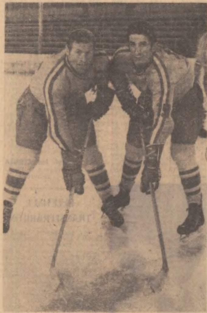
Prima noastră linie de fundasi, Varga-Scheau, este datorată cu o reabilitare după evoluția sub posibilități în meciurile de la Sofia.