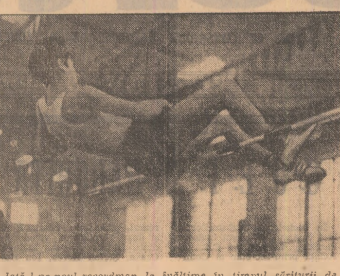
lata-l pe noul recordman la inaltime in timpul sariturii sa 1,96 m