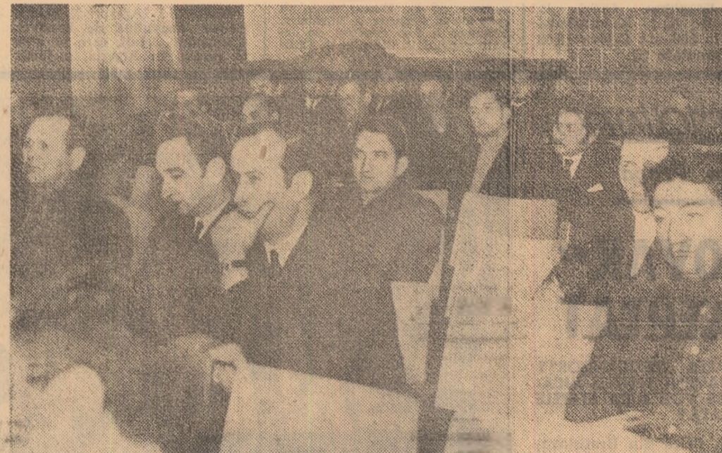
Reprezentanții echipelor de divizie A și B ascultă punctul de vedere al federației, la un aspect din sală

Performanța ultimului este mai mult decât meritorie, cunoscut fiind faptul că, din motive de boală, el a stat o vreme departe de activitatea fotbalistică.