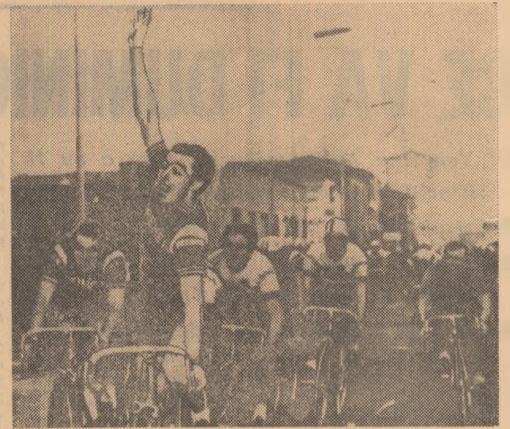
Ciclistul belgian Patrick Sercu (în fotografie, trecând primul linia de sosire) a câștigat a doua etapă a Turului Sardiniei, Cagliari — Oristano (125 km). În clasamentul general, continuă să conducă însă Eddy Merckx.