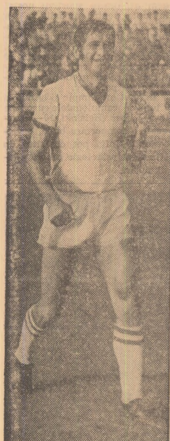
(Urmasre din pag. 1)

Sutele de mii de iubitori ai fotbalului de pe tot cuprînsul țării sînt convocați, de duminică, în fiecare săptămîna pe stadioane... Se reia campionatul.