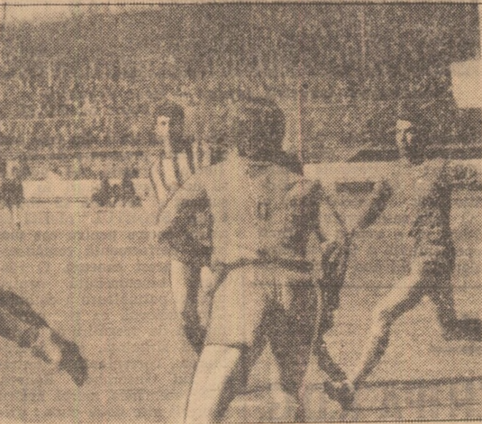
Iată-l pe masivul Corăman — singurul atacant constănțean care a... deranjat, cit de cit, apărarea Stelei — amenințînd, la unu din puținele contraatacuri ale oșpelerilor.

Fond de premii: 424.376 lei. Plata cîștigurilor va începe în Capitală de la 19 martie pînă la 23 aprilie, în țară de la 23 martie pînă la 28 aprilie 1971, în cluj.