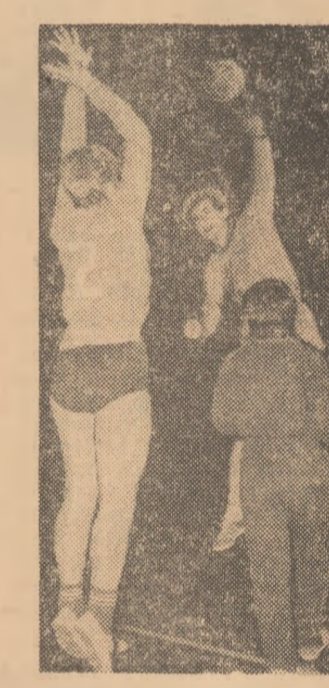
Imagine de la ultimul antrenament al handbalistelor noastre.