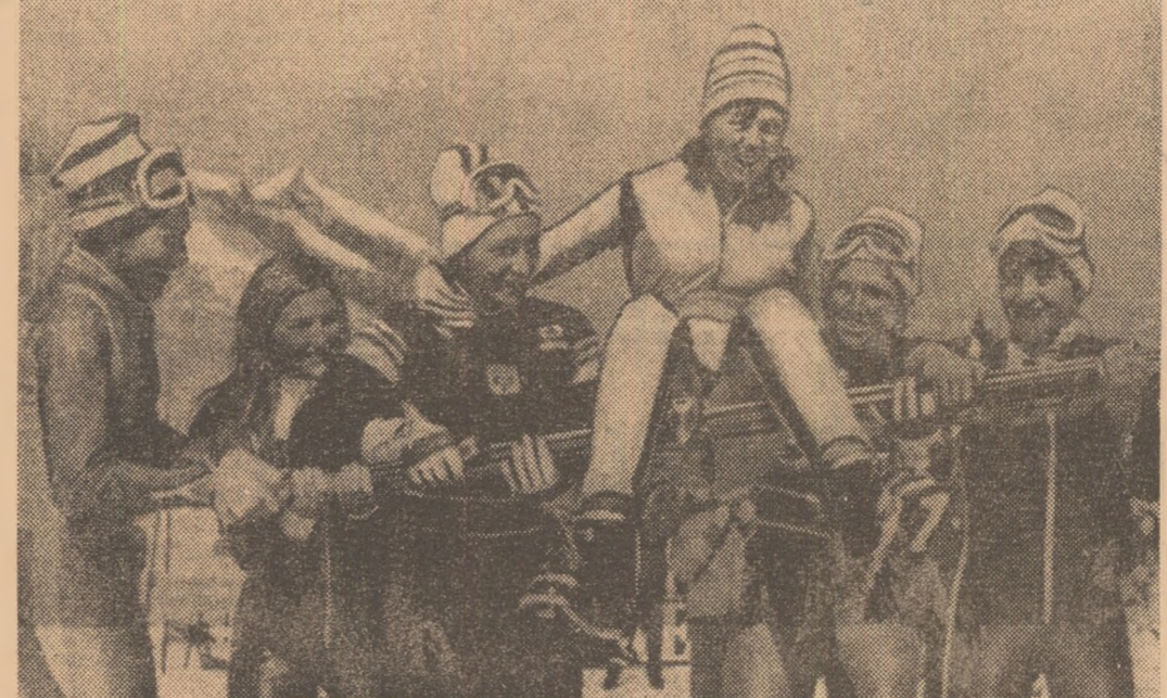
Prima schioară a sezonului 70-71, surprinzătoarea Anne-Marie Proell, purtată în triumf de kolegele ei din echipa Austriei, după ultima cursă cîștigată la Aare.

15 ani și a obținut prima mare victorie internațională anul trecut, în slalomul urias de la Marlbor. O consacră o medalie de bronz la coborîre, la campionatele mondiale, iar un antrenament excepțional de pregătire fizică făcut în toamna trecută îi aduce acel plus de