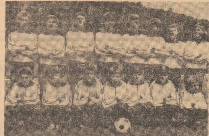
Fiejenoor? Celtic Glasgow? Nu, diniață după toate regulile în materie, echipată în elegante trenin-guri, „reprezentativa - născuți în 1956“ a Școlii generale nr. 69 din București, echipă din care - ne mărturisea profesorul Stoisor - „vor ieși citeva nume despre care veți scrie într-o bună zi și reportajul... de-o pagină!“

Aflată la o aruncătură de băț de stadionul „23 August“, Școala generală nr. 69 reprezintă o unitate de învățămînt aparte: elevi a 4 din cele 25 de clase ale ei - o clasă a V-a, una a VI-a, una a VII-a și una a VIII-a - urmează un program cu SPECIALIZAREA FOTBAL.