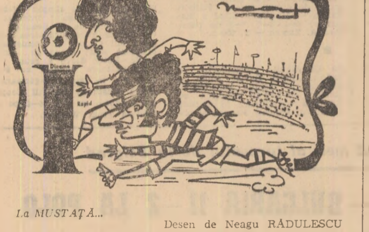
La MUSTAȚĂ... Desen de Neagu RĂDULESCU

la sută — la Rotterdam. Subliniat, impus atenției și stimul tuturor, rezultatul pozitiv obținut în deplasare înseamnă — adeseori — o linie performanță — valoare. Un 6-3 de pildă, realizat de marea echipă a Ungariei în „templul fotbalului”, pe Wembley, în compania Angliei, a însemnat — la vremea respectivă — o diplomă cu blazon. Toată lumea a înțeles în ziua acelei partide memorabile că „11-le lui Hitchcock”, „Puskas”, „Boszik”, „Grosics”, „Kocsis et. comp.” este o mare forță în fotbalul mondial.