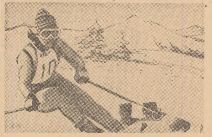
Excelenta schioară austriacă Anne Marie Proell, în plină cursă

five trebuie să înceapă în școală, evident, pentru că insufletește și obișnuiește încredințată de timpuriu, să giudească sănătos, să practice exerciții mișcării și, totodată, să se supună autodiscipliniei". Președintele Franz Jonas atribuie de asemenea o mare valoare sportului de masă, cu vechi tradiții în Austria: „În afara sportului de performanță, competitiv, apreciez că sportul de masă se cultivă scos din încorsetarea unei stricte specializări, a unei riguroase disciplinări. Personal am practicat numeroase sporturi, tocmai pentru a evita exclusivismul. Și acum culeg roadele practicii sporturilor în tinerețe: sănătate deplină, vigoare, spirit de rezistență morală și hotărâre în orice acțiune". Acordând o înaltă apreciere rolului educativ al sportului, președintele Austriei a relevat zărilor: „Este necesar ca sportul să conducă la acele înfăptuiri constructive, la respectul partenerului și în același timp la respectul adversarului, aducând și în acest fel o prețioasă contribuție în munca de educare a tineretului sportiv".