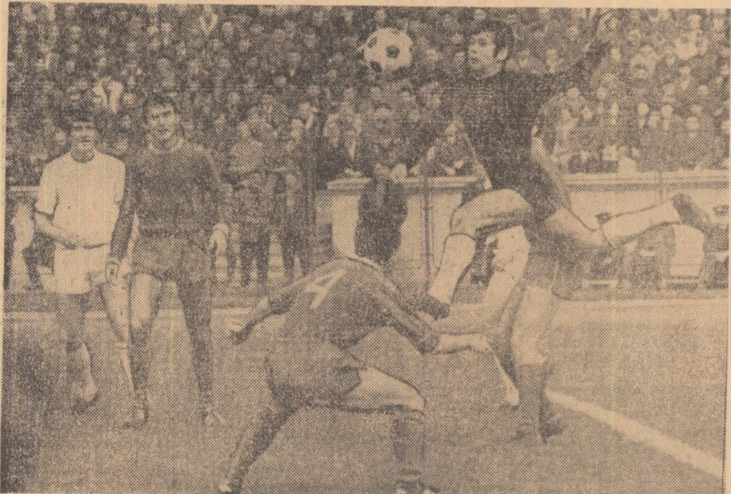
„Zbor Manta”, așa s-ar putea intitula această secvență surprinsă la meciul etapei, în care portarul echipei Progresul intervine spectaculos, respingând un atac al dinamoviștilor.

● Dinamo București sancționată pe teren propriu ● U.T.A. smulge un punct și așteaptă acasă pe Rapid și Dinamo ● La revedere, C.F.R. Timișoara! ● Jiul și C.F.R. Cluj intens periclitat de revenirea Progresului