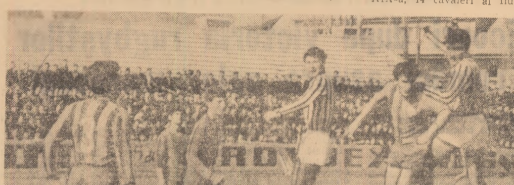
În meciul Metrom — A.S.A., mureșenii (în echipament de culoare închisă) au obținut un rezultat de egalitate (2-2) și au câștigat un „punct mare” în lupta pentru promovare.

Duminică de duminică, 32 de formații, cu gânduri și năzuințe pe măsura puterilor, a loziturilor de care dispun și a condițiilor materiale factor de joc neglijabil) se întrec cu ambiție în cel de al doilea esalon al fotbalului nostru — DIVIZIA B.