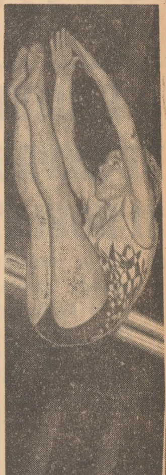
După mai multe luni de pauză competițională, Melania Deuceșă și-a făcut o reîntoarcere promițătoare