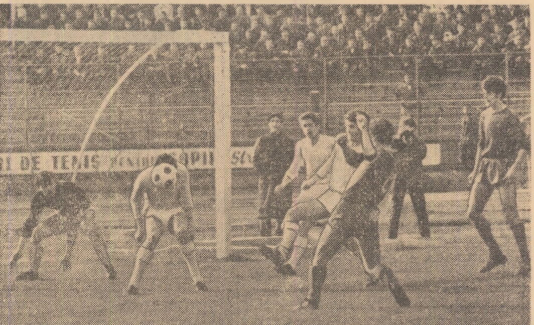
În minutul 31 bucureștenii s-au aflat foarte aproape de deschiderea scorului, dar golul a refuzat să cadă: revenită din bară, unde fusese trimisă de Tănăsescu, mingea este reluată de Raksi, dar nici de astă dată nu va intra în plasă, lovindu-se de capul lui Antonescu