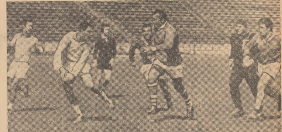
Rugbyștii Italiei în timpul antrenamentului de acomodare. Un frumos schimb de pase între compartiment

și ca jucător, dar și conducător al echipei, este destinată să asigure acestui compartiment (și