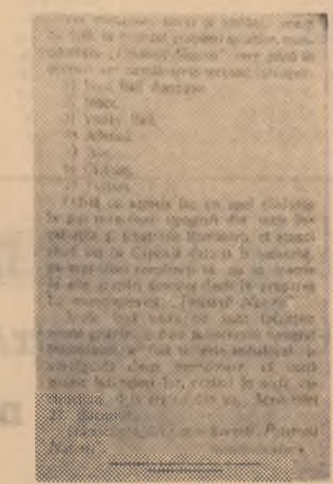
Fragment din articolul publicat în numărul din 24 septembrie 1922 de revista „Munca Grafică“