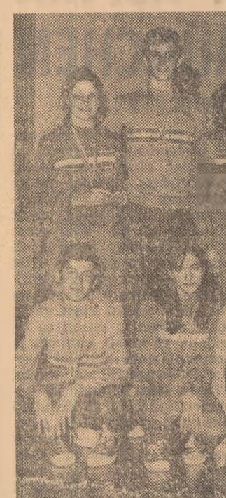
O amintire plăcută pentru echipele Liceului nr. 35, campioane naționale.

După multe deziluzii, anul 1971 ne-a oferit, cu prilejul turneelor finale ale campionatelor naționale școlare și de juniori, evoluții satisfăcătoare a unei generații cu adevărat de perspectivă. Nu exagerăm cu nimic afirmînd că la Sibiu am văzut mulți jucători și multe jucătoare de valoare reală, capabili să facă parte chiar și acum din primele garnituri ale echipelor divizionare frunțase. În acest sens, finala dintre formațiile masculine ale Liceului 35 București și Școlii sportive Cluj a fost elocventă, ea oferind nu numai un spectacol excepțional, ci și o întrecere ca-