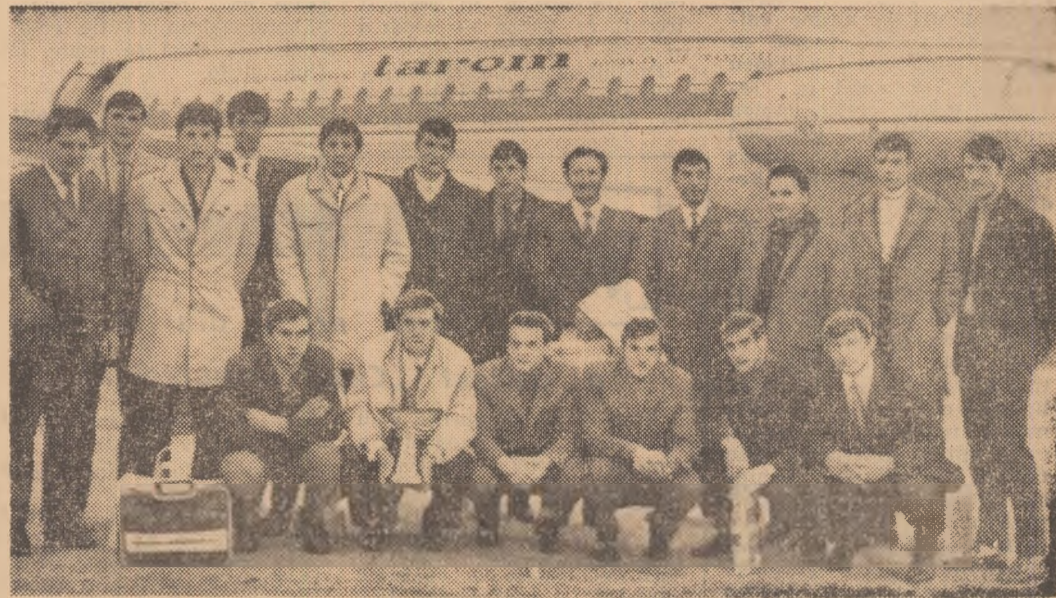
Lotul handbaliștilor români care a participat la „Cupa Țărilor Latine“ a revenit, ieri, în Capitală, iată-i surprinși, imediat după sosire.