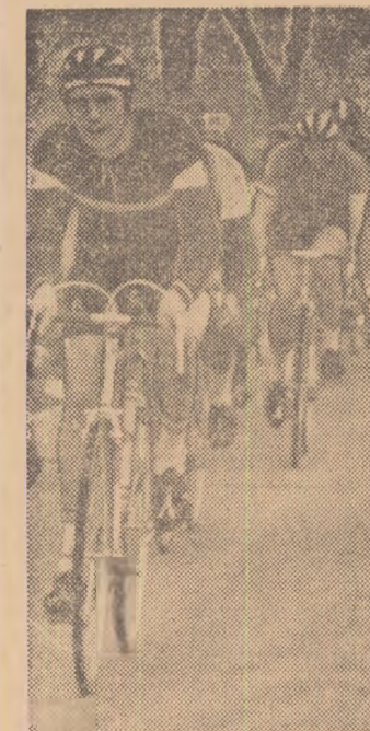
Plutonul începe să se întindă. În prim plan: Mircea Virgil, de la Metalul Plopeni

Dacă ar fi să notăm pe toți cei aflați, prin rotație ne-am spune, pe avansposturi, ne-ar trebui o listă destul de lungă.