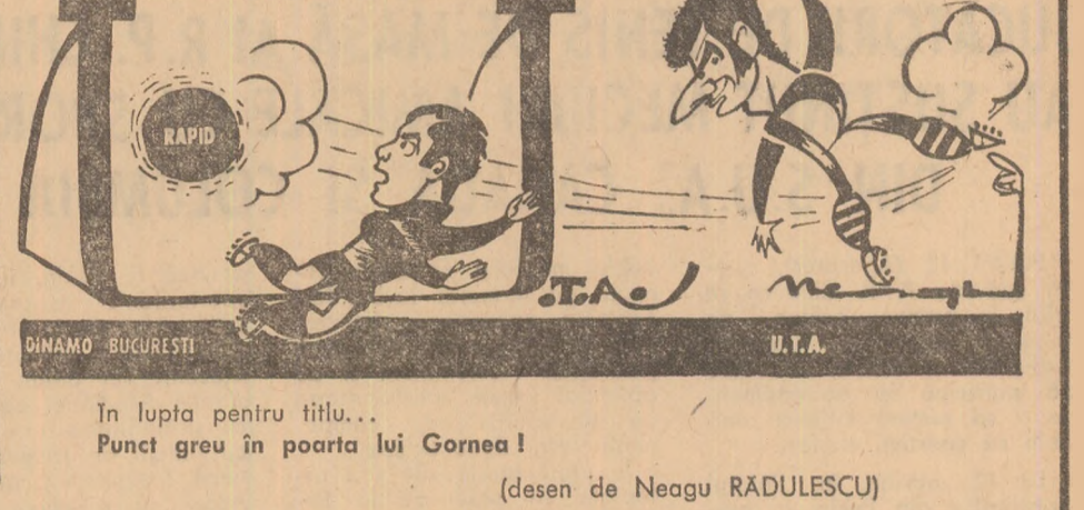
În lupta pentru titlu... Punct greu în poarta lui Gornea! (desen de Neagu RADULESCU)