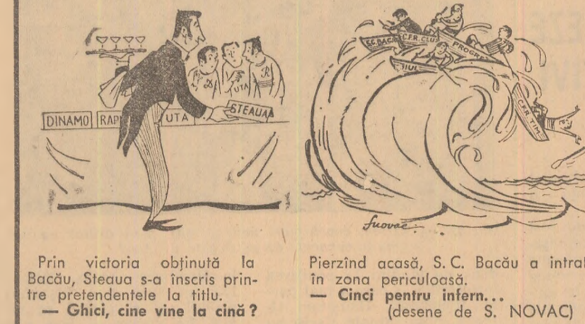
Prin victoria obținută la Bacău, Steaua s-a înscris printre pretendenții la titlu. — Ghici, cine vine la cină? — Cinci pentru infern... (desene de S. NOVAC)