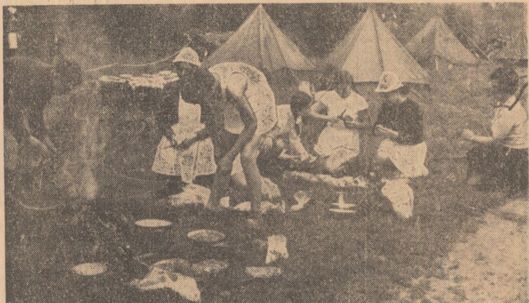
O reușită tabără de corturi pe malul Begăi. Iată-i, în imagine, pe unii dintre elevii timișoreni pregătind micul dejun.