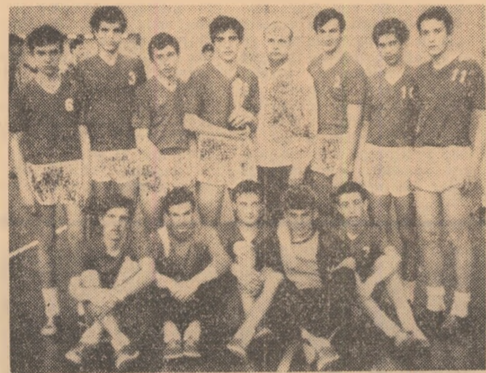
La Cluj s-a încheiat recent competiția de handbal dotată cu „Cupa Semicentenarului”. În foto, echipa câștigătoare a trofeului, selecționata orașului gazdă

...s-a încheiat recent etapa I — intergrupe — la nivelul centrului universitar la următoarele ramuri sportive: fotbal, inot, baschet, tenis de masă. Cu prilejul diferitelor întreceri s-au înregistrat adevărate recorduri de participare, dintre care amintim: 4.300 studenți la inot, 3.900 la baschet, 3.000 la fotbal, 2.200 la