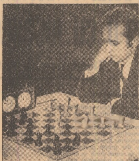
Florin Gheorghiu în timpul unei partide de șah.

Am jucat bine, dar m-am clasat prost, spune Florin Gheorghiu, în primul dialog după întoarcerea de peste Ocean. Am scapat locul II — care mi s-ar fi convenit — în partidele cu Savon și Pla-