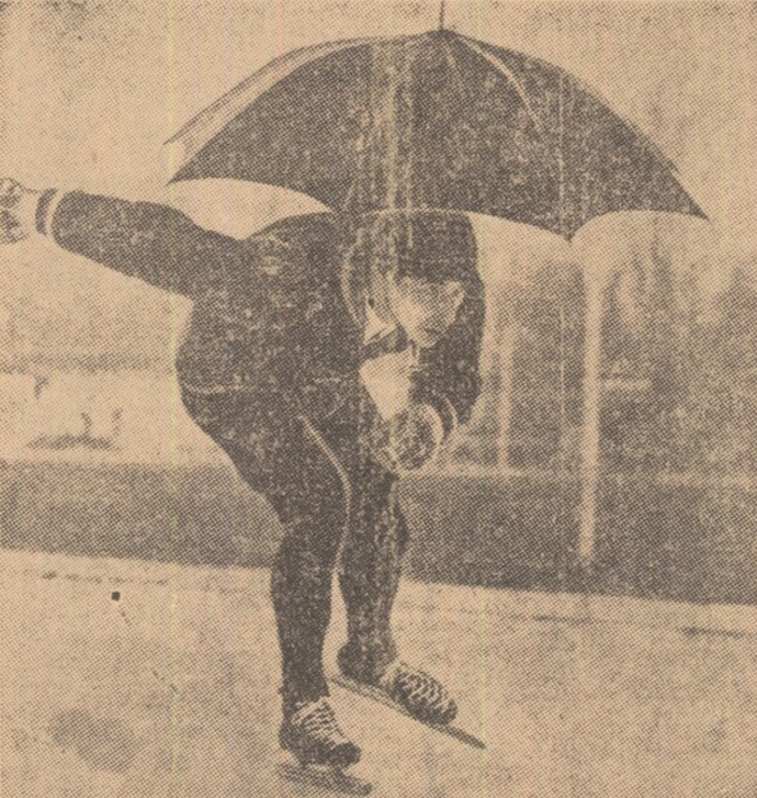
Ploile de primăvară nu par să-l descurajeze pe ex-campionul mondial de patină viteză, olandezul Kees Verkerk, care-și continuă cu sîrguință antrenamentele, protejat de o umbrelă. Fiecare minut este prețios pentru a-și păstra nealterată forma sportivă. Iar pînă la viitoare concursuri de patină, ne mai desparte doar o singură vară...