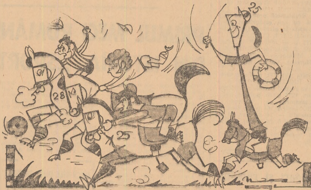
De la stînga: Rapid, Dinamo, Steaua și Farul Desen de NEAGU RADULESCU