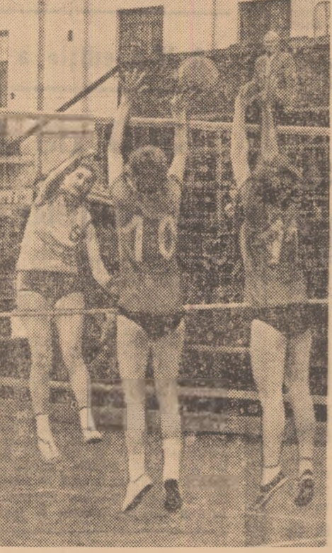
Atac reușit al voleibalistei Hidmăgănu de la C.P.B. in partida cu Flacăra roșie.