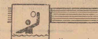
Un atractiv turneu international in Capitala