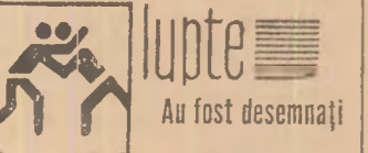
Au fost desemnați campionii de juniori pe 1971 la libere