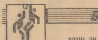
DORIM UN TURNEU FINAL DE CALITATE!