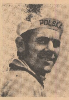
Rutierul polonez Ryszard Szurkowski, pentru a doua oară consecutiv, învingător.

Printre ei s-a numărat din păcate și cicliștii români Teodor Vasile care, de-a lungul multor etape s-a situat printre frunțiși. El a fost nevoit să cedeze pasul în această etapă.