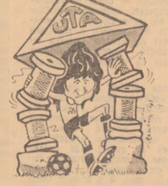
SAMSON (versune fotbalistică).

O veste bună pentru simpatizanții acestei echipe: re-întră Domide, care în Belgia a avut o comportare satisfă-cătoare. Broșovschi și-a ispă-șit pedeapsa (o etapă de suspen-dare), astfel că formația va avea următoarea componență: Gornea — Birău, Lereter, Po-joși, Popovici, Domide, Petes-cu, Broșovschi, Axente, Kun II, Fl. Dumitrescu. (ȘT. IA-COB — coresp.)