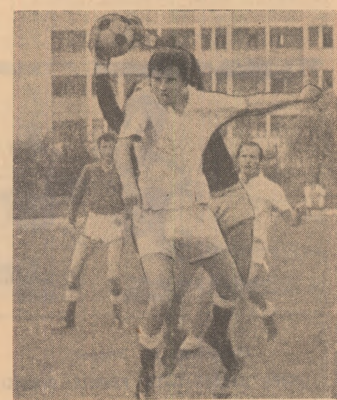
O acțiune a jucătorilor ieșeni la poarta echipei Institutului Pedagogic Tg. Mureș