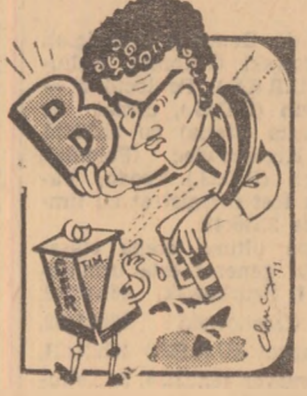
Neagu: — Nu plînge! E bînd și „jucăria” asta pînd mai crești!

După un amical cu Jiul (scor 1-1), în cursul săptămîinii, feroviarii timișorenii au susținut și un joc-scoală cu Electrobanat, din campionatul județean. La antrenamente a reapărut portarul Gaboras, dar el nu este încă refăcut. De asemenea și Seceleanu este indisponibil. În fața fostei sale echipe, pe care a eliminat-o din Cupă, antrenorul D. Macri intenționează să folosească următorul „11”: Co-rec — Pirvu, Mehedinți, Bodojan, Boșea, Donca, Chi-miuc, Floares, Regep, Bojin, Periatu. (P. ARCAN — corespondent).