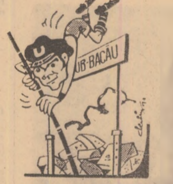
Peza: Dar să nu zic „shop”, pînă nu sdr!

de Munteanu I, și Barbu (de cite două ori). Formația proba-bilă este cea din jocul de la Alba Iulia, la care se adu-gă și Anca, revenit vineri de la campionatele studențești. Deci: Ștefan (Moldovan) — Crețu, Pexa, Solomon, Cim-peanu, Anca, Șimel, Ulfalea-nu, Adam, Barbu, Munteanu I. (M. VICTOR, coresp.)