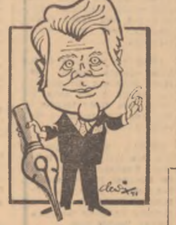
Moldoveanu: — Vă arăt eu cum se scrie istoria meciului PETROLUL — PROGRESUL!

Progresul a jucat miercuri în deplasare, cu F. C. Carabul (div. C) și a învins cu 1-0 (1-0). Din formația ban-carilor au lipsit Beldeanu și Năstase, ușor accidentați în meciul de la Tg. Mureș, cu formația de tineret a Cehoslovaciei. O altă indisponibilitate o constituie Grama. În locul său va fi utilizat Dudu Georgescu. Dacă medicul va aviza utilizarea lui Năstase și Beldeanu, „11”-le de astăzi va fi următorul: Zamfir — Tă-născu, Măndolu, Dudu Georgescu, Ad. Constantin, Beldeanu, Dumitriu, I. Sandu, Răcksi, Năstase, Cassal. (FL. SANDU)