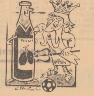
— Revenind, bătrîne! Alea sînt pruna, nu puncte!

În ultima partidă de verificare, Farul a înfrînt pe Delta Tulcea, de care a dispus