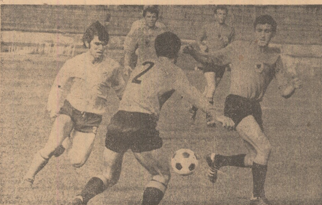
iluzia că echipa Albaniei nu va încerca din prima repriză restabilirea egalității în jocul celor două manșe (aveau de recuperat golul de la București)

Iordănescu, revelația meciurilor de calificare cu reprezentativa Albaniei, în luptă cu nu mai puțin de 4 adversari