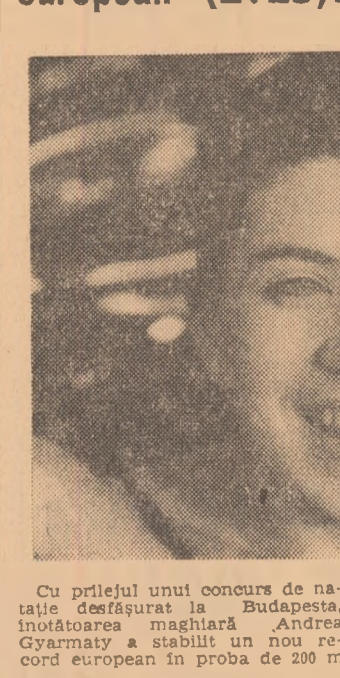
Cu prilejul unui concurs de naționale desfășurat la Budapesta, înotătoarea maghiară Andrea Gyarmaty a stabilit un nou record european în proba de 200 m