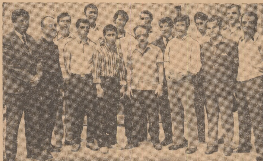
Delegația țării noastre participantă la campionatele europene de box, surprinsă înaintea plecării de către fotoreporterul nostru, Drașoș Neagu.

● H. Stump il va înlocui — probabil — pe I. Monea ● Starea sănătății lui A. Năstac nu este îngrijorătoare