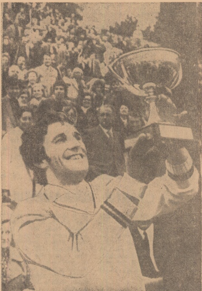
Jan Kodes gustă din plin clipele marii bucurii prilejuită de cîștigarea turneului de la Roland Garros

JAN KODES: „A fost cel mai greu meci al meu din întregul concurs. Sînt fericit că am putut să mă revanșez în fața lui Năstase după înfrîngerile de la Roma și Nisa. Mă simt foarte obosit.” ILIE NĂSTASE: „Am pierdut o mare finală, dar sper să-mi iau revanșa la Wimbledon.”