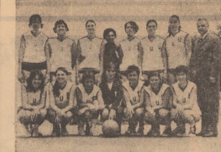
lată reprezentantele Timișoarei în divizia A.