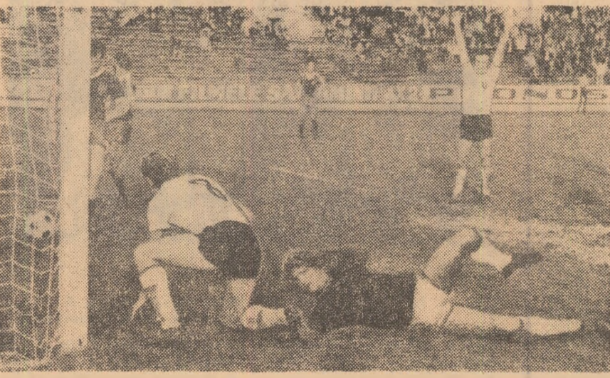
Facă din meciul „U”-Cluj — Furul, din etapa disputată miercuri. Deși fănași în 10 oameți, conștiința reușiseră să con- ducă până în minutul 75 cu 2-1. În momentul în care universitarii clujeni au ieșit să eceleze prin Anca (nr. 8).

Impotriva intervenției imperia- liste americane. În cursul dimineții, delega- ția de partid și guvernamen- tală a Republicii Socialiste România, condusă de tovarășul Nicolae Ceaușescu, a vizitat Expoziția industrială și agri- colă a Republicii Populare Democrațe Coreene din Phen- ian. La încheierea vizitei, tovarășul Nicolae Ceaușescu scrie în cartea de onoare: „Viziți expoziția industrială și agri- colă, am rămas plăcut impresio- nat de succesele remarcabile obținute de poporul coreean sub conducerea Partidului Muncii din Coreea. Adresăm poporului coreean cele mai