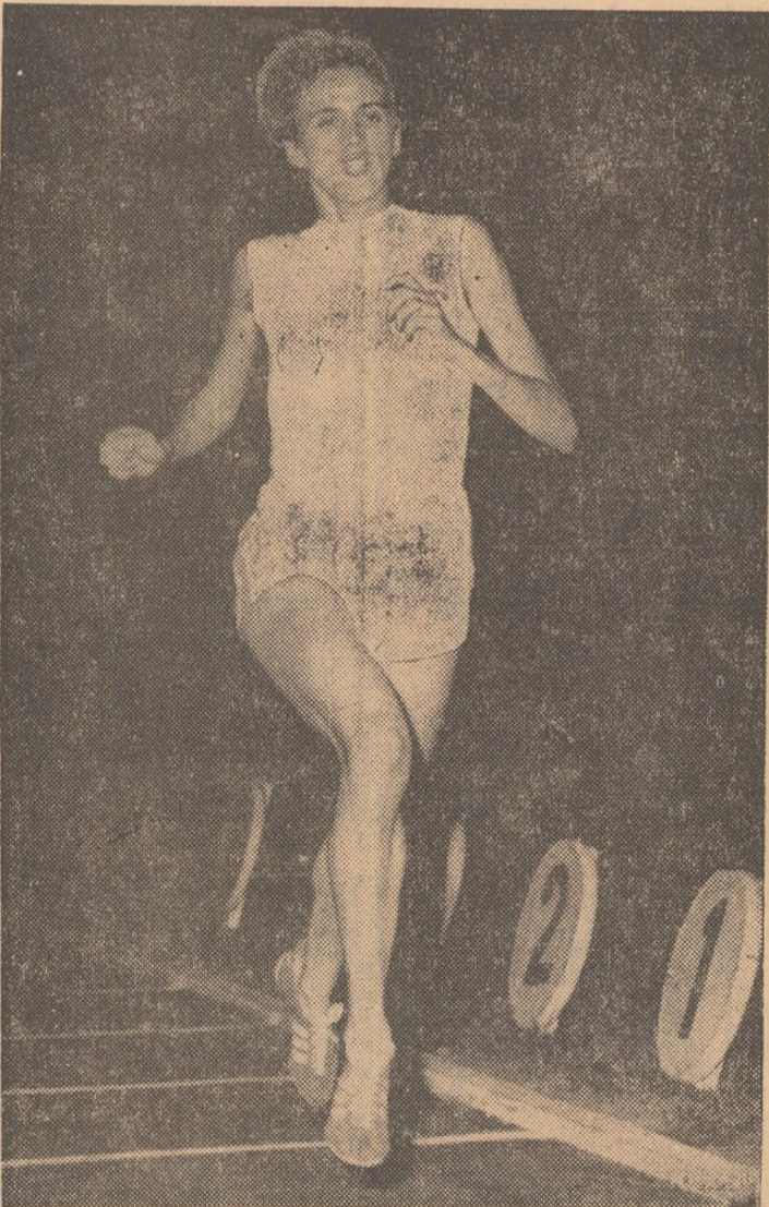
Ileana Sila a înregistrat vineri excepționalul record de 2:01,6 pe 800 m.

Intâlnirea de la Praga a prilejuit atletelor române nu numai o frumoasă victorie internțională, ci și posibilitatea de a realiza câteva performanțe cu totul remarcabile care se înscriu printre cele mai bune din lume. Ne bucurăm aceste rezultate pentru că ele dovedesc largile posibilități ale atletelor din țara noastră, în fața cărora se află numeroase alte competiții de anvergură și în primul rând campionatele europene de la Helsinki.