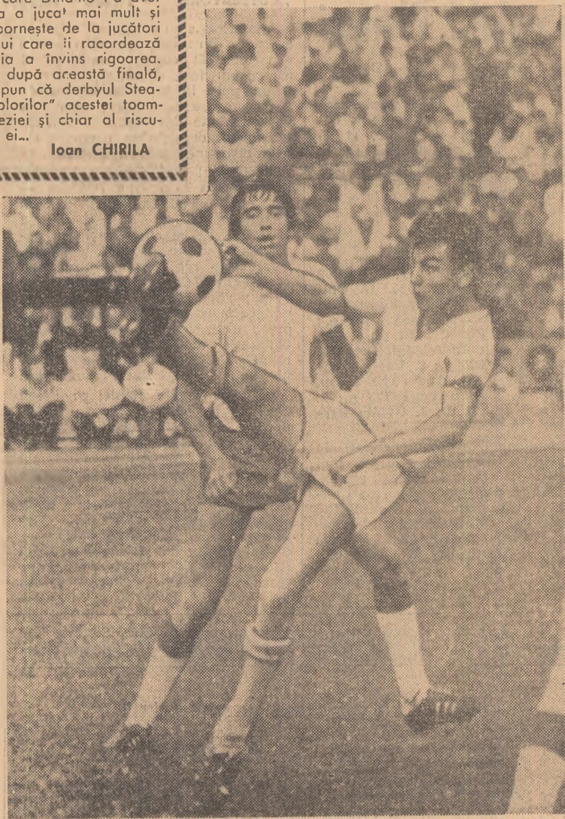
Balet aerian în finala campionatului de juniori