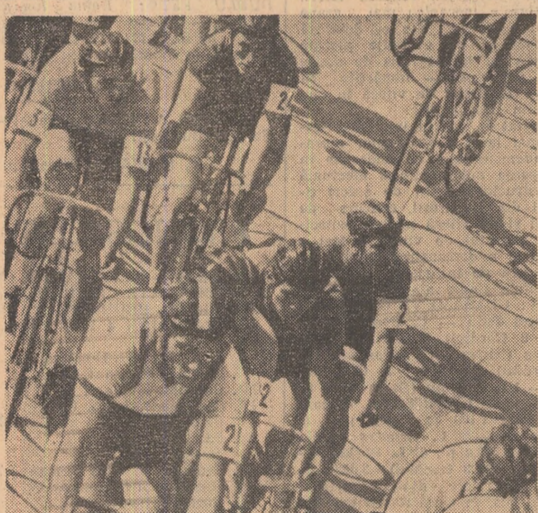
Aspect din desfășurarea cursei cu adăușuri de puncte