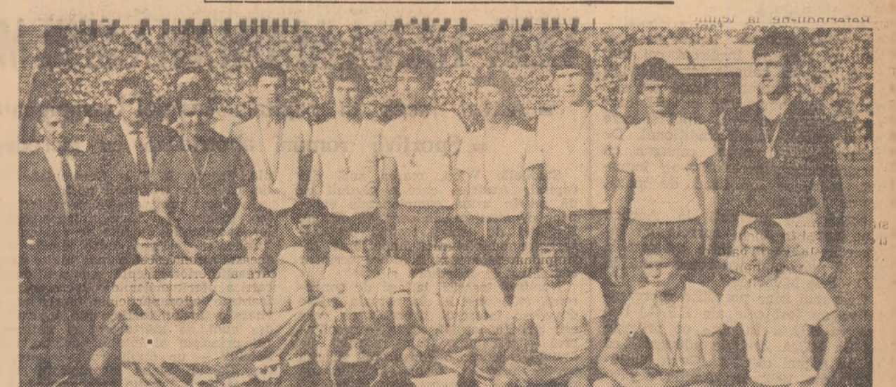
Școala sportivă de elevi Sibiu — campioana țării la juniori. Un titlu surprinzător, dar meritat.