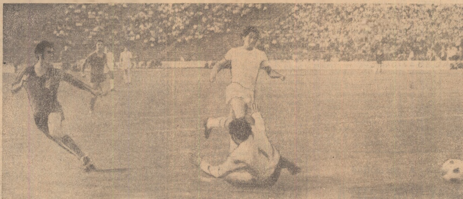
Golul acesta, al treilea înscris de Tătaru, a adus a 11-a Cupă Stele