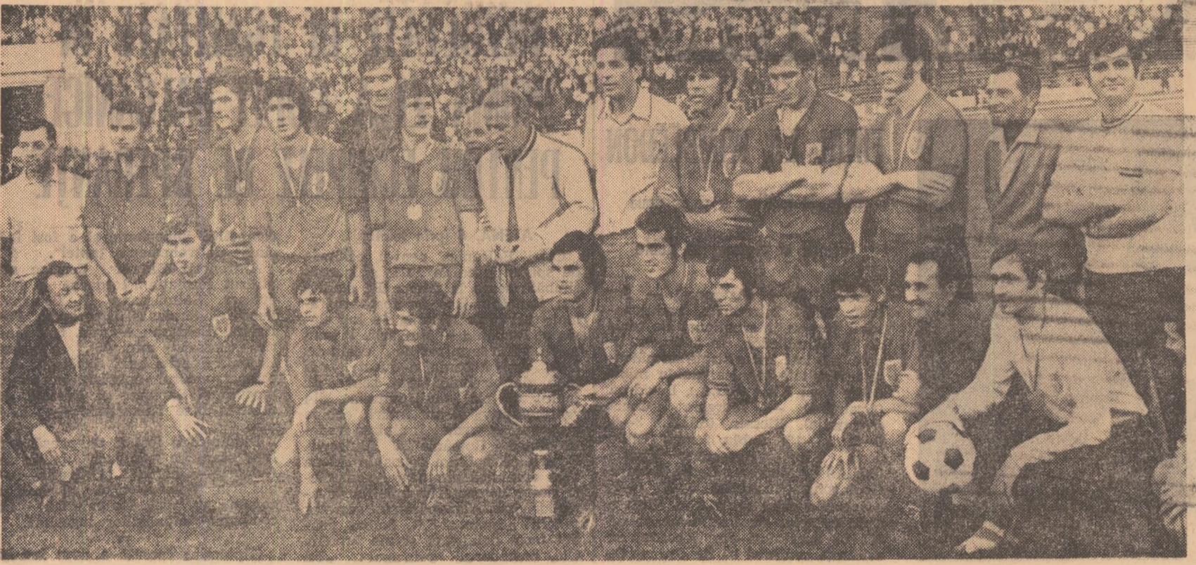
Marea satisfacție, din final, a câștigătorilor „Cupei României” ediția 1970-1971.