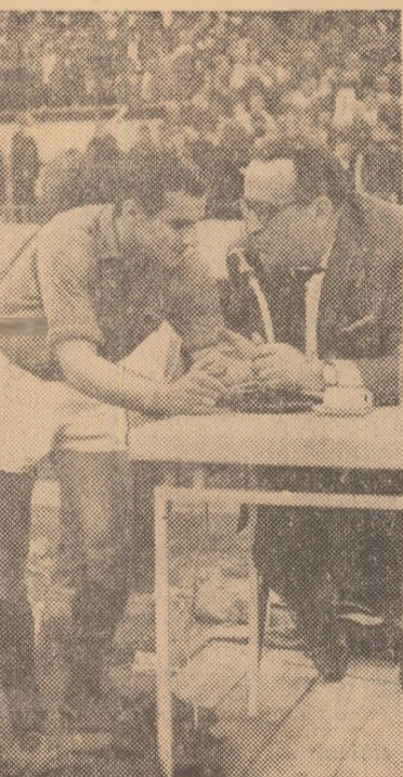
Iosip Skoblar, reputatul fotbalist iugoslav, care activează la Olympique Marseille, acordînd un interviu crainicului sportiv al postului de radio Belgrad, Radiote Markovici.

● Rezultate din „Cupa Inter-toto”: F.C. Zilric — AB Copenhagen 2-1 (0-0); Elfsborg-Borras — Tatra Prešov 2-3 (1-1); F.C. Kaiserslautern — Hvidovre Copenhagen 2-2 (1-2); ASK Linz — BK Copenhagen 0-0; Austria Viena — T.J. Trjinec 3-1 (1-1); Borussia Dortmund — ROW Rynbnik 1-2 (0-0).