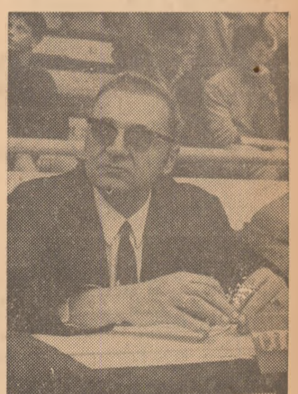
tele mondiale, vă rugăm să ne spuneți în ce măsură turneul de la Constanța a prilejuit o repetiție de calitate?

— Pentru că peste puțin timp se vor desfășura la Sofia campiona-