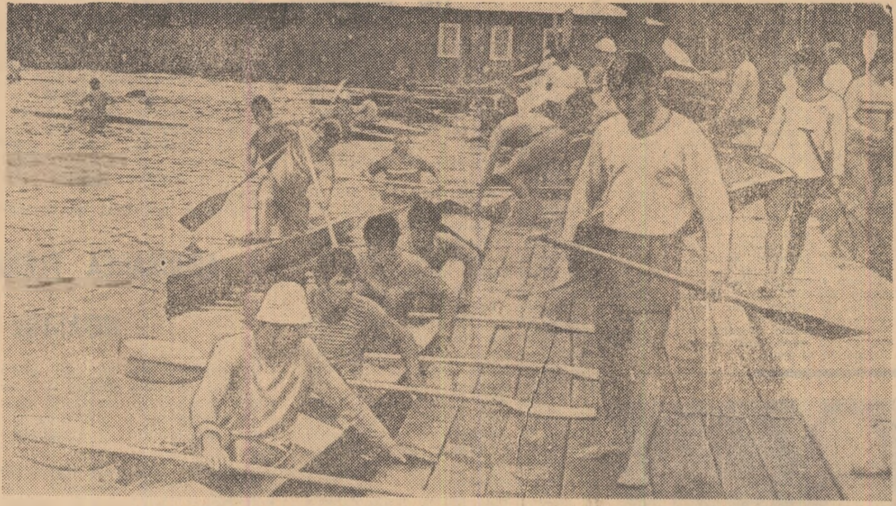
Plăcuta forță a ambarcaunilor, înaintea fiecărui antrenament. Ieri, călăuziți și canoștii noștri și-au continuat pregătirile pentru starturile de simbioză și duminică.

Un amănunt interesant: la regata internațională vor lua parte și 6 sportivi — reprezentînd cluburile din Berlinul occidental — prezența lor fiind explicată de înfrînarea revanșă cu echipa clubului Steaua. Cîteva cuvinte despre lotul țării