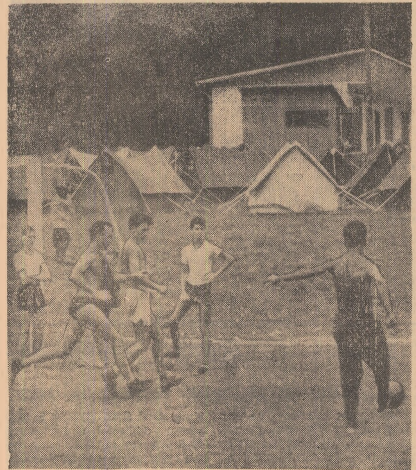
Moment de destindere în tabără